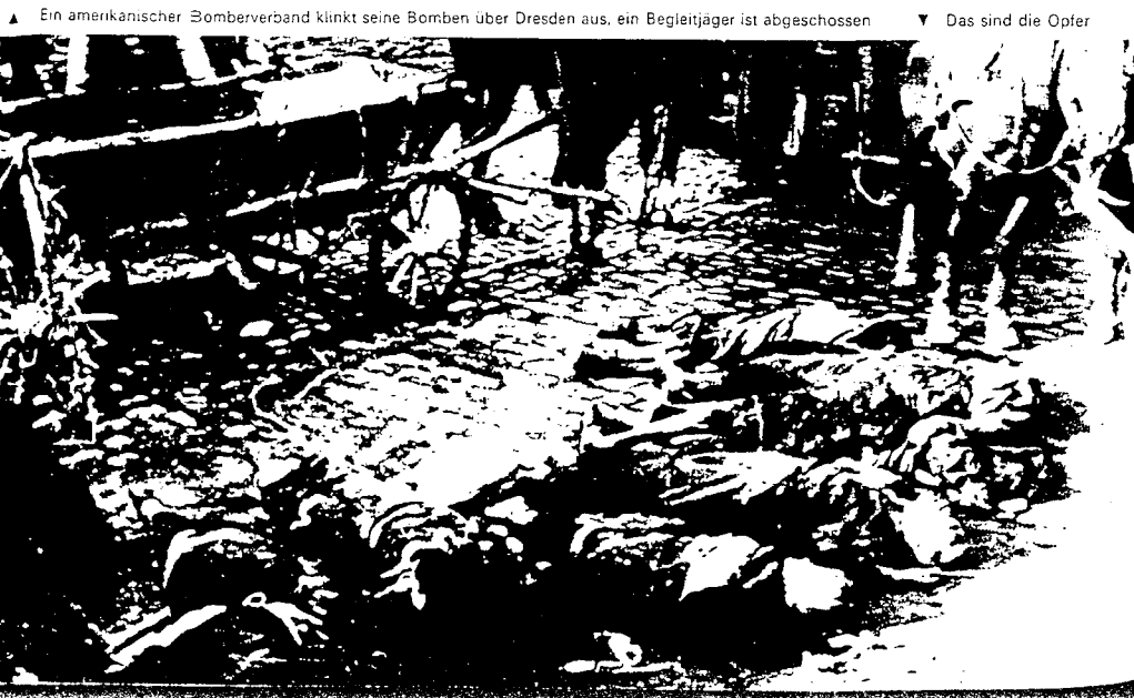
▲ Ein amerikanischer Bomberverband klinkt seine Bomben über Dresden aus, ein Begleitjäger ist abgeschossen ▼ Das sind die Opfer

Die Intensität des Flächenbombens steigerte sich mehr und mehr. Die Großstädte des Ruhrgebietes und bald auch des weiteren Hinterlandes sanken in Schutt und Asche. Zynisch sprach Churchill über die Sender der BBC, die deutsche Bevölkerung brauche nur ihre Städte zu verlassen, ihre Arbeit aufzugeben, auf die Felder zu flüchten und ihre brennenden Häuser aus der Ferne zu beobachten. Ihren absoluten Höhepunkt erreichten die Verluste bei der Zivilbevölkerung in dem »Rund-um-die-Uhr-Bombardement« des mit Flüchtlingen aus den Ostgebieten vollgestopften Dresden. Da es in der Stadt kaum kriegswichtige Objekte zu verteidigen galt, war die Flakartil-