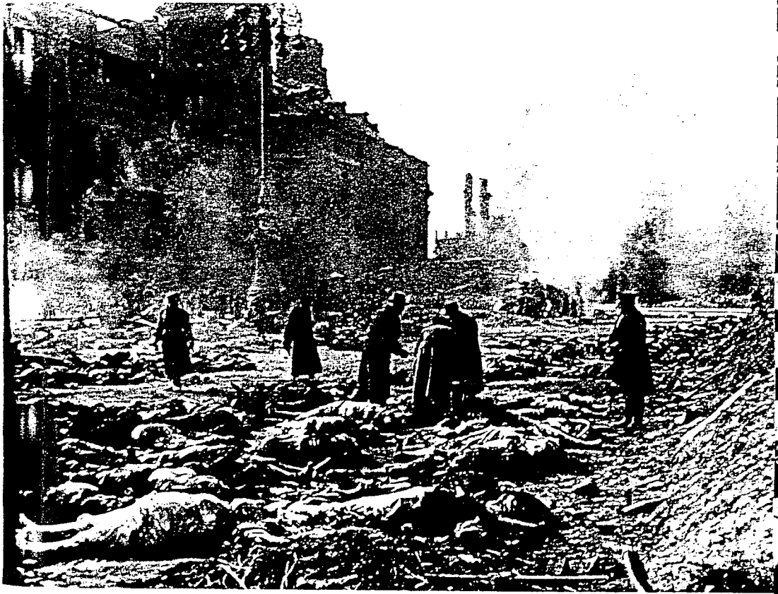
Tagelag verbrennen russische Hilftswillige auf Schienenrosten die Leichen der Opfer