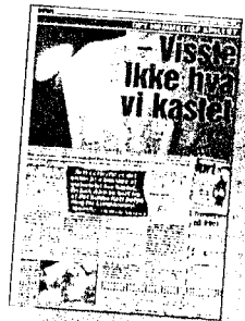
Dagbladet sist onsdag.