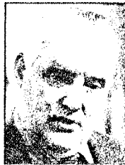
TAUS: Forsvarsminister Dag Jostein Fjærvoll tar bare mot skriftlige spørsmål knyttet til saken om spiondokumentene som ble kastet.

Ved forsvarsministerens kontor får Dagbladet klar beskjed om at Dag Jostein Fjærvoll bare tar mot skriftlige spørsmål knyttet til denne saken. Han ønsker ikke å bli kontaktet på annen måte.