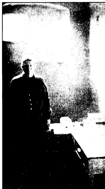
I TÅRNET: I fengslet arbeidet Vidkun Quisling hver dag med sine forsvarsinnlegg. Her er han i sin celle i det beryktede «tårnet» på Akershus festning. Han ble overført til Møllergata 19 før han ble henrettet.

Men mange historieinteresserte besøkte ved hvor de skal gå for å se murveggen ved krutthuset på Akershus hvor Quisling endte sine dager.