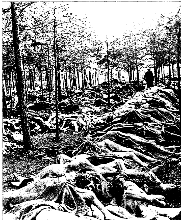
Utryddelsen. Diskusjonen om Nazi-Tysklands jødeforfølgelse raser i dag på begge sider av Atlanteren.

Å fremholde at dette er vanskelige og sjelsoppripende problemstillinger, er omtrent som å si at «det trekker litt» når orkanen flerrer taket av huset ditt. Og fredsdelig er diskusjonen ikke blitt. Den har fått ny fart også i Europa etter Holocaustkonferansen i Stockholm i vinter. Noen av bidragene preges av en bitterhet som