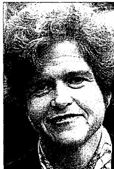
Rettsak. Historikeren David Irving følger seg injurert av den amerikanske professoren Deborah Lipstadt, som anklager ham for å benekte at jødeutryddelsen var et systematisk iverksatt folkemord.

ødeutryddelsen var et systematisk iverksatt folkemord på Hitlers ordre. Lipstadt hevder at Irving gjentatte ganger har formulert utsagn som bare kan tolkes slik.