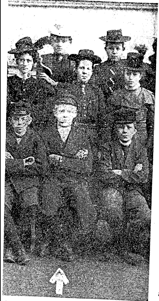
ed Pil) med sine Skolekammerater fra Drammen Skole.

penborg- løbene i Dag. 1945's og 1946's Derby-Heste