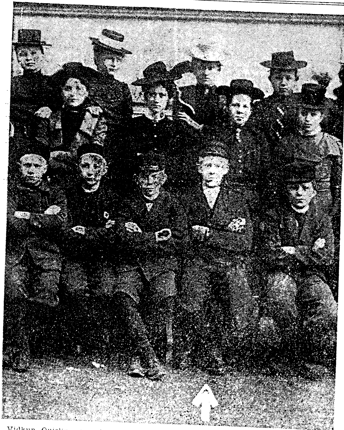
Vidkun Quisling (mærket med P!) med sine Skolekammerater fra Drammen Skole.