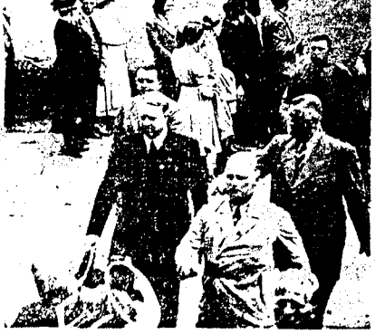
De norske Statsaktens Deltagere. Til venstre: Rigs-kommissær Terboven og Vidkun Quisling paa Vej til Slottet.

Efter Afslutningen af Statshandlingen lod atter Kirkeklokkerne. Og ved Mørkets Frembrud gik et stort Fakkeltog dannede af Nasjonal Samlings Hird og Tusinder af Medlemmer gennem Oslos Gader — en ualmindelig