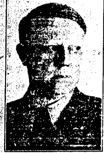
Statsminister Vidkun Quisling

OSLO, i Gaar. Officielt meddeles: Efter Anmodning af de norske Ministre har Vidkun Quisling overtaget Posten som Norges Statsminister. Rigs-kommissær Terboven har givet sin Billigelse hertil og accepteret den hidtidige Regerings Demission-begæring. Statsminister Vidkun Quisling vil gaa i Gang med Dannelsen af en national norsk Regering. I denne Anledning fandt der Søndag paa Oslos Fæstning Akershus, der er bygget i det 13. Aarhundrede som et Mindesmærke for norsk Historie, en højtidelig Statsakt Sted, i hvis Forløb Rigs-kommissær Terboven og Statsminister Quisling holdt vejledende Taler om Norges Stilling i det nye Europa og dets politiske Fremtid. 818