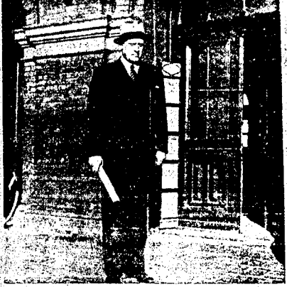
Statsminister Vidkun Quisling

I et Stemningsbillede fra Skandinavisk Telegrambyrås Oslo-Korrespondent herunder det stille ned over den norske Kongeborg, og i Timerne for Statsakten strømmede Nasjonal Samlings Medlemmer til. Gennem Gaderne marcherede den ene Hirdafdeling efter den anden, og alle Akershus myldrede af Liv. Norske Politisoldater i fuld Feltstyr med Staalhelme og Rifler, flankerede Vejen til Slottet. Vejen gik op ad den trange