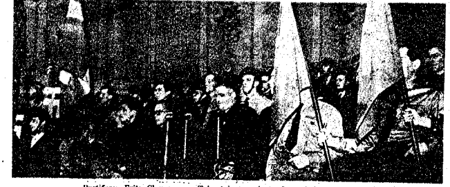
Partifører Frits Clausen paa Talestedet omgivet af Storkøbenhavn S. A.

Handelsfører over det Hav, hvor der ligen Frihed er, men hvor der gennem Aarhundreder har været opretholdt en Voldstilstand med Plyndring og Rov af Privatsjænder og med Blodkade som i Terje Vikens Tid.