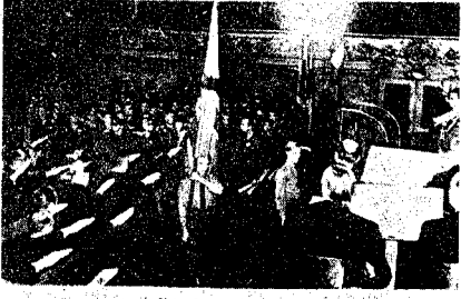
Østlandernes føres Ind

Selv om vi er neutrale, er vi dog ikke uberoerte af Krigens, lige saa lidt som vi var det i 1914—18, hvor alle 1918 søvendes, 1918 danske og 1162 norske Samfund mistede Livet i Fredens Tid.