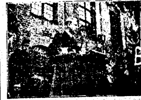
Vidkun Quisling paa Talerstolen i Koldinghus Slotsgaard

Intet var der at sige Quislings Administration og faglige Forudsætninger paa som Forsvarsminister, og saa gjorde d'Herrer Hambro (Højre), Mowinckel (Venstre),