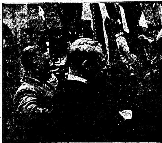
Vidkun Quisling og Frits Clausen under Mødet Søndag den 18. Juni 1939.

talere, og sagde nu til mig: Det er meddelt, at National Samlings Fører, fhv. Forsvarsminister Vidkun Quisling er ankommen til Kolding og bor paa Hotel »Royal«. Vil Du