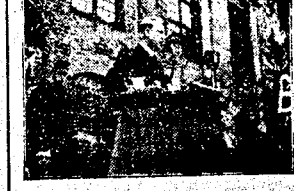
Vidkun Quisling paa Talerstolen i Koldinghus Slotsgaard

bort. Der var kun én Udvej, at Systempartierne, ligesom nu her i Landet, dannede Samlingsfront imod det nye. Her, og kun her, er nemlig Systemets inderste Bevæggrund til at »samle sig», forøvrigt en fysisk Umulighed indenfor et parti- og klasseopdelt Samfund. Intet var der at sige Quislings Administration og fæglige Forudsetninger paa som Forsvarsminister, og saa gjorde d'Herr Ham-bro (Højre), Mowinkel (Venstre),