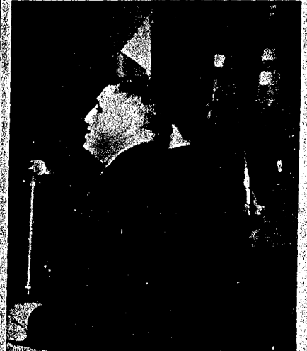
Partifører Frits Clausen i en karakteristisk Situation under sin Tale.

hed overfor Frits Clausen, som har taget Initiativet til dette værdige Samarbejde mellem de nordiske nationale Partier. Jeg vil udtale Danken om, at de tre nordiske nationale Fredsbevægelser maa være i Stand til at samle Norden i et Fællesskab, de nordiske Folks Forbund af Hjerternes Drift og Blodets sammholdende Kraft. Ikke med tomme Ord. Hvad der sendes gennem Blod, maa ogsaa heles gennem Blodets Raat. Med forenede Vaaben, forenede Kampmaal vil det blive et enigt og mægtigt Norden. Ogsaa den svenske Partiførers Tale hilstes med kraftigt Bifald. Den danske Afdeling indledtes ligeledes af Orkester med Lange-Müllers lyrisk skønne og nationale Musik til "Der var engang". Bedre Valg kunde man ikke have truffet fra Ledelsens Side, og selvom det falder lidt udenfor Rammerne ligeledes at give en