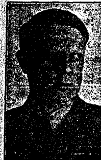
Statsminister Vidkun Quisling

OSLO, i Gaar Officielt meddele: „Efter Anmodning af de norske Ministre har Vidkun Quisling overtaget Posten som Norges Statsminister. Rigskommissær Terboven har givet sin Billigelse hertil og accepteret den hidtidige Regerings Demissionsbegæring. Statsminister Vidkun Quisling vil gaa i Gang med Dannelsen af en national norsk Regering. I denne Afpledning fandt der Søndag paa Oslos Fæstning Akershus, der er bygget i det 13. Aarhundrede som et Mindesmærke for norsk Historie, en højtidelig Statsakt Sted, i hvis Forløb Rigskommissær Terboven og Statsminister Quisling holdt vejledende Taler om Norges Stilling i det nye Europa og dets politiske Fremtid.“ STB