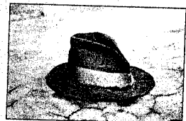
Hamsuns hatt, Nørholm 1951.