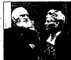
Hamsun med kona Marie, som nettopp var kommet hjem etter fire år borte fra mannen.