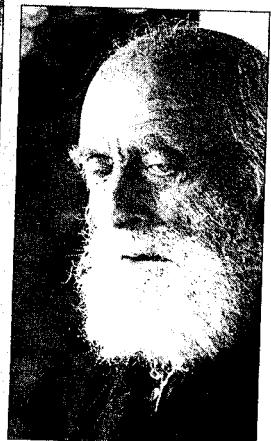
Svært få hadde sett Hamsun med langt, hvitt skjegg da disse bildene ble tatt.