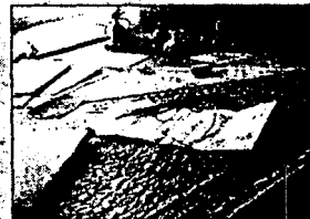
Hamsuns skrivebord på Nørholm – her ligger blant annet en registrering fra Hotell Norge i Lillesand.

– Gyidendals bildesjef sa følgende: «Knut Hamsun er passé. Det er ingen som er interessert i å se bilder av ham. Det er heller ikke god butikk».