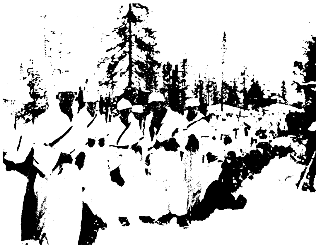
Skijegerbataljonen i Nörd-Karelen.

lasarettet råka av ein russisk granat, strømmen gikk, og jenta kom med stearinlys. Pasientane raste over at Stalin kunne skyte på eit Røde Kors-merka lasarett. Men ho tok det kaldt: «Es ist doch Krieg, meine Herren.»