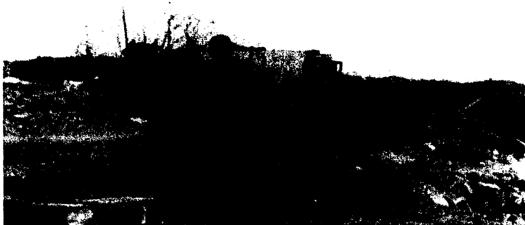
Den norske legion. Olaf Lindvig ved Leningrad-fronten 1942.

var offiserar, som meinte at den norske kapitulasjonen i juni 1940 var absolutt, og at vi ikkje var i krig med Tyskland lenger. Mest halvdelen av dei norske offiserane frå før 9. april 1940 var da innmelde i NS (Dahl, side 228).