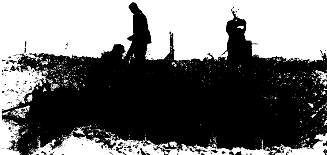
Den norske legion. Bunkers ved Leningrad 1942.

å få alle utanlandske soldatar ut av landet på kort varsel. Samtidig med den tyske Lapplandsarméen måtte restane av den norske bataljonen marsjere frå fronten aust for Karelen, gjennom heile Nord-Finland til Skibotn i Norge. Dit kom dei ei stund før jul i 1944. Forflyttingane måtte helst gjennomførast om natta, for om dagen kom det stadige angrep frå finske soldatar og fly, som ville ha meir fart i tilbaketrekkinga. (Sjå også stykket om Neuhaus i dette årsskriftet).