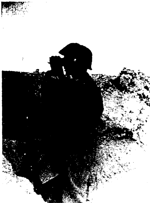
Regiment Norge, vest for Leningrad 1944.