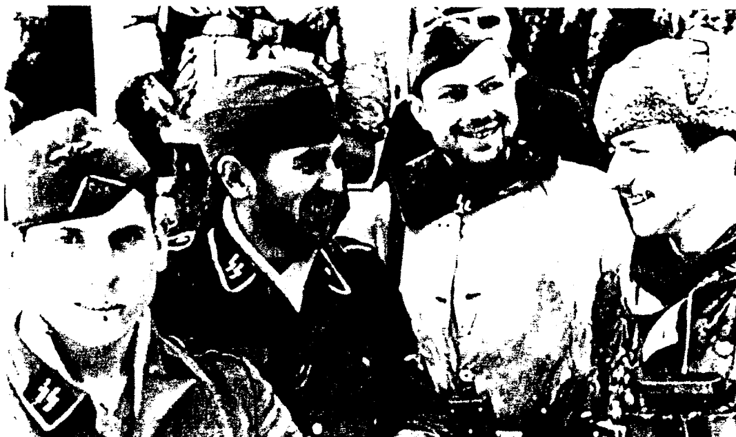
Regiment Norge, soldatar frå ulike nasjonar.