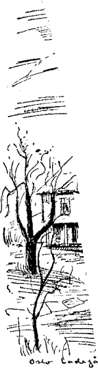
Ute i Gamlebyen

Bispegaten og Oslog Ladegård, som kan meget interessant hildgården er nemlig byggetasjen av den gamle hvor blant annet den bisp Nikolus Arnesson re Bispeborgen bestod av et festet tårn og en stor hallbygning, et kapell og flere andre bygninger innenfor en ringmur. Det kan være av interesse å vite at det var Bispeborgen at den første unions-traktat mellom Norge og Sverige ble undertegnet i 1319. Etter reformasjonen i 1538 mistet kirken mye av sin makt, og Bispeborgen ble krongods som alt annet kirkegods i Norge. Kong Chri-