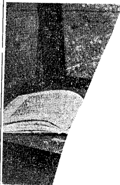
På bildet er Ingvald Ur

I forbindelse for Ingvald Ur og Unive ling i H gen ble overbit Fløgst Sjøvo nings de v tak. fru sti