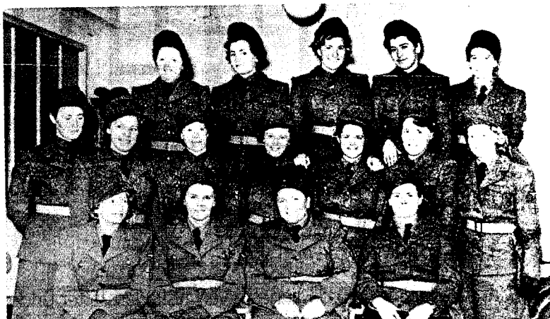
MOT ØST: Den første kontingenten kvinner i Den norske legion er klar til avreise mot fronten.