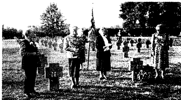
GRAVSTED: Syv norske front søstre er gravlagt på en kirkegård i Wien. På bildet minner overlevende sykepleiere vennene som falt.