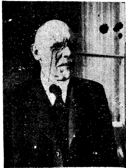
Dr. Johan Scharffenberg.

For dem som visste bedre har det lenge vært klart at det var noe som skulle og måtte skjules. Og meget er også blitt skjult. Godt skjult. Det hadde