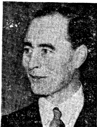
Mannen som på grunn av sin politiske fortid ikke kan komme til Amerika. Det er i så måte ingen ulikhet mellom ham og de han i dag forfølger.