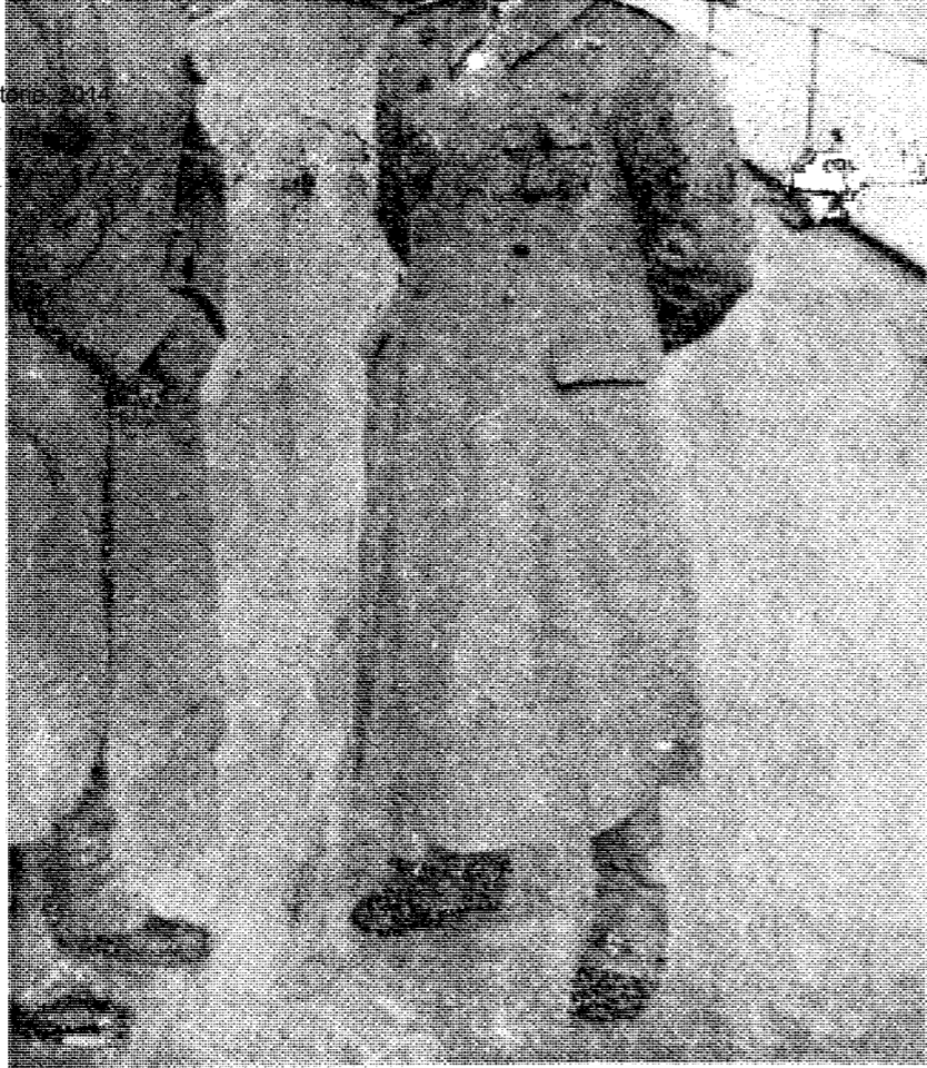
Kong Haakon og kronprins Olav ombord i «Devonshire», like før den norske forsvarsmakts kapitulasjon 10. 6. 40.