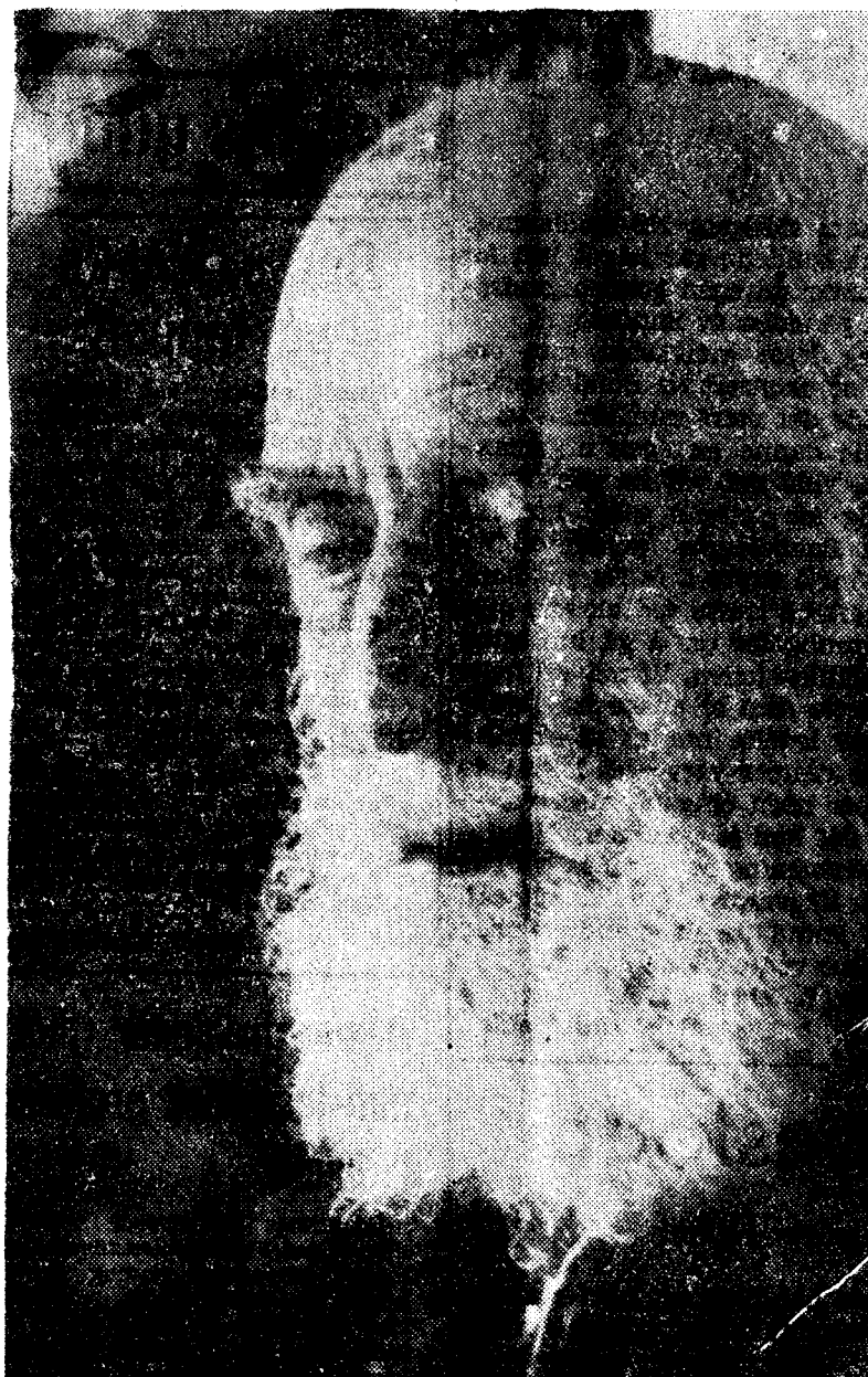
EN AV NORGES STØRSTE SØNNER, NOBELPRISTAKEREN KNUT HAMSUN, SOVNET STILLE INN NATT TIL 13. FEBRUAR 1952, 92 ÅR GAMMEL.

KNUT HAMSUN fikk ingen fredelig og lys alderdom — til evig skam for det folk som har solet seg og vil sole seg i hans ry. Da gatens parlament herjet som verst brente mobben hans bøker og ville redusere hans navn til intet. Det var ikke måte på ondskap, og som kronen på verket trakk de ham for retten og dømt ham som «landssviker», ham som engang sang for dem: