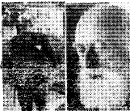
De siste bilder av dikteren

Som tidligere nevnt fører denne del av fru Hamsuns livserindringer frem til Knut Hamsuns 80-årsdag høsten 1939. Okkupasjonsårene og det som fulgte etter «frigjøringen» er ikke behandlet i denne del av erindringerne. Flere anmeldere av boken har uttrykt sin glede over at boken er så velsignet fri for bitterhet, — bl. a. også «Arbeiderbladet»s kritiker. Helt kjemisk fri for bitterhet er boken imidlertid ikke, og det kunne den vel heller ikke godt bli etter alt det som hadde rammet dikterhøvdingen og hans familie. Jeg formoder at fru Hamsun har skrevet boken etter at hun er kommet litt til ro etter alle påkjenningene i forbindelse med «rettsoppgjøret», og da har hun vel ikke kunnet unngå å minnes hva som nylig var hendt henne selv og dem som sto henne nær. Noen korte innskudd i slutten av boken gir gripende uttrykk for hva hun selv og Knut Hamsun må ha lidt og følt. Som f. eks. da fru Ham-