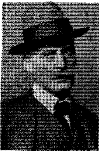
Hamsun i mandommens år

Som jeg allerede har gjort oppmerksom på handler over to tredjedeler av boken om fru Hamsuns samliv med den store dikter som hun i 1909 knyttet sin skjebne til og som hun i gode og mindre gode dager trofast holdt sammen med til døden satte det endelige punktum for et sjelden beveget og innholdsrikt liv. Det er naturligvis denne del av fru Hamsuns bok som av de fleste vil leses med den største interesse, og fru Hamsun er ikke den som gnieraktig holder på sitt materiale. Med ødsel hånd gjengir hun i denne del av boken brev og utdrag av brev som hun mottok fra eller sendte som svar