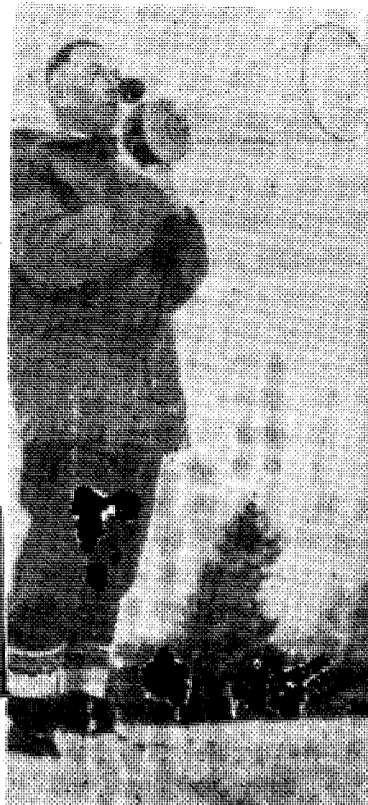
Biskop Tvebotten med megafon.