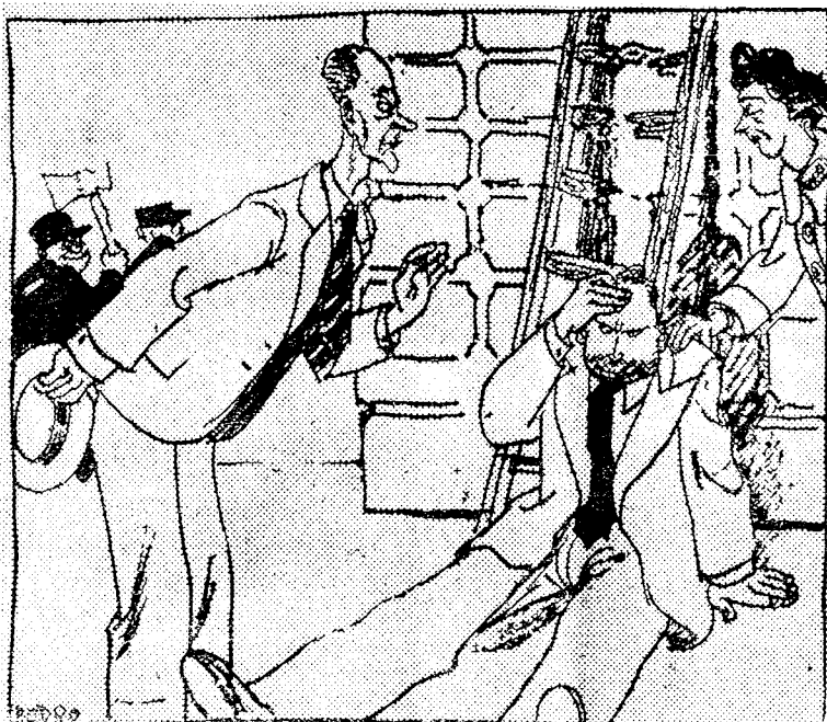
Tidl. Milorg-sjef filosoferer

— Det er da forargerlig også at nettopp NS-folkene skulle ta knekken på meg nå ti år etter! — Ikke ta det så tungt, Jensemenn, det er enda mange departementer du ikke har forsøkt deg på. (Verdens Gang.)