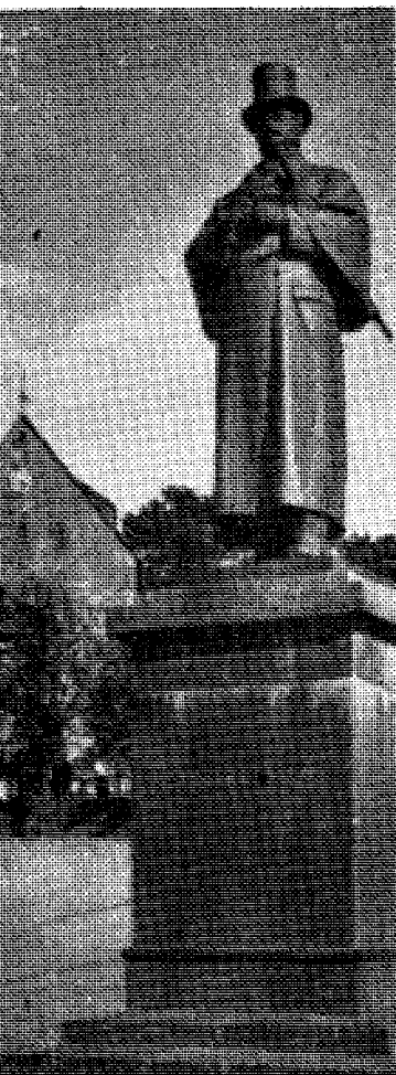
Bjelland-statyen, kjent blikkfanger i Stavanger. I bakgrunnen Domkirken, bygget 400 år før Amerikas historie ble påbegynt.

I en anmeldelse i Minne-vesteuropiske land for å