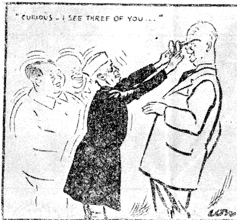
«Gjennom indiske briller» har den verdensberømte tegner David Low kalt denne tegning i Manchester Guardian. Eisenhower har fått Nehrus briller på seg og skimter i bakgrunnen Mao og Krusjtsjev.

En ting er nokså tydelig like etter årsskiftet. Det storpolitiske initiativ er for øyeblikket slått ut av hendene på de europeiske stormakter i vest, og den hektiske storpolitiske virksomhet har vesentlig vært utøvet av utenom-europeiske statsmenn: Amerikas Eisenhower og Dulles, Indias Nehru og Chinas Chou Enlai. Selv Sovjet har vært så opptatt med sine vanskeligheter i Øst-Europa, at det først nå lot høre fra seg igjen. Hvis det ikke blir noen forandring i planene, skal Chou fly til Moskva 12. januar.