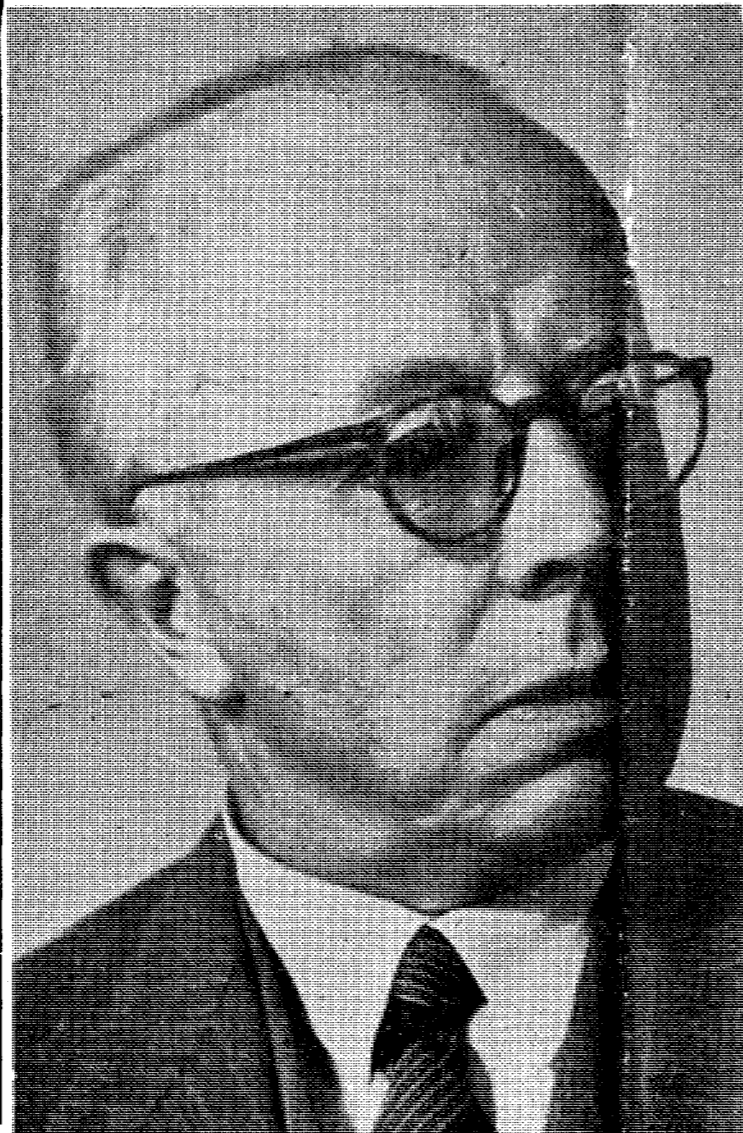
Eivind Blehr døde 27. juli i sitt hjem på Nesø Hovedgård.

Eivind Stenersen Blehr var født 20. januar 1881 på Lærdalsøyra i Sogn, sønn av senere statsminister Otto Blehr og hustru Randi, f. Nielsen, Bergen. Han gikk på skole i Oslo, Førde, Tromsø og Stockholm før han tok eksamen artium ved Aars & Voss skole i Oslo i 1899 og juridisk embetseksamen i 1903. Han var deretter edsvoren fullmektig