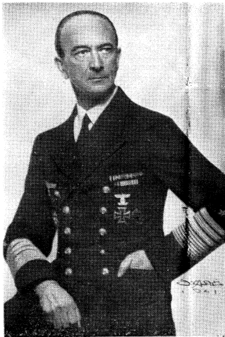
Generaladmiral HERMANN BOEHM

«Wenn unsere Operation nicht aggressiv war, den war ihre als einzige Möglichkeit,