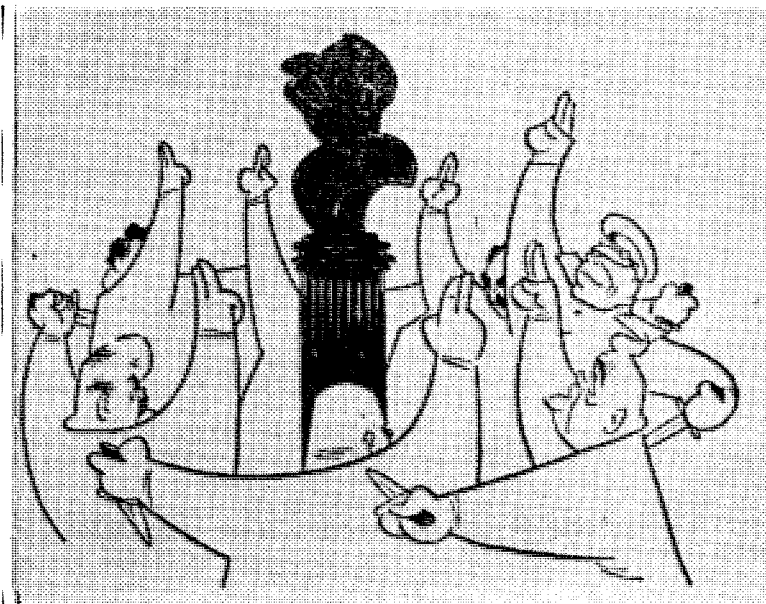
Troskapsed — på den gode, gamle måten.