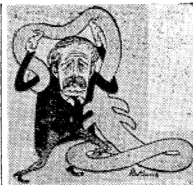
Macmillan kjemper en drabelig kamp for Englands økonomi.

skal i nærmeste framtid utvides meget betydelig. Hver enkelt av oss får nu gjennom den nye skattordning vite dette så det svir. En sviing som kan ledes til en folke-reisning mot de offentlige klør. Fra 1930 til 1938 var jeg sekretær i Fedrelandslaget hvis grunntake var å samle de borgerlige partier til ett; og gjennom studiesirkler og folkemøter bekjempe kommunismen i alle dens forkledninger. Fra 1938 til krigsutbruddet holdt jeg de fleste forsvarsforedrag fra landsende til landsende som sekretær i «Lansforeningen Norges Sjøforsvar». Min gasje i disse kampens år begynte på 4 og endte på 8 tusen. Kjære innsender: Der bør