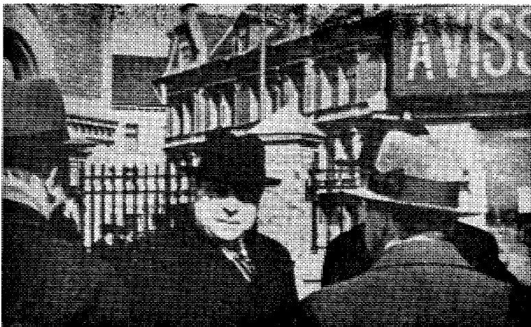
Stortingspresidenten på vei til Elverum 9. april 1940.

Det spørs om du greier å vekke det franske folk med Marsellaisen. Husk det var de tyske marsjer som ga deg sjansen den gangen — — —