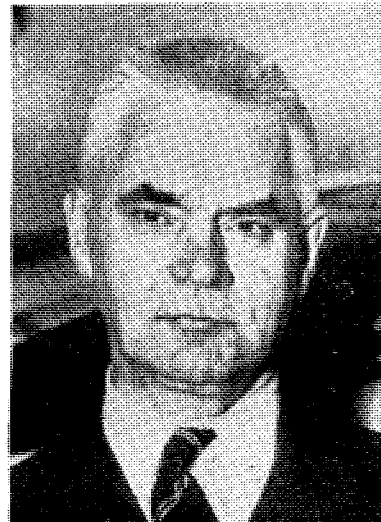
Brannfarlig utenriksminister 1940

Planer som uten general Eisenhower og den mektige tyskhatende kamarilla som sto bak ham, ville ha kunnet redde Europa fra den katastrofe som fulgte på den tyske kapitulasjon og som fremdeles rir Europa og andre deler av verden som en mare. Sentinel.