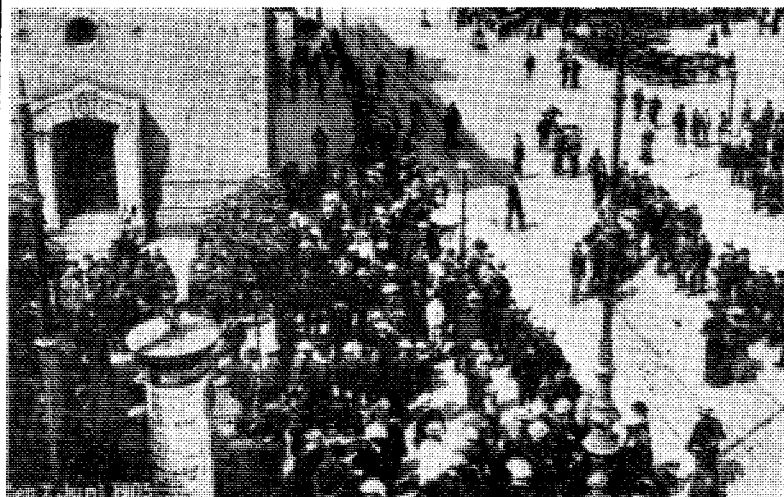
Utenfor Stortinget 7. juni 1905