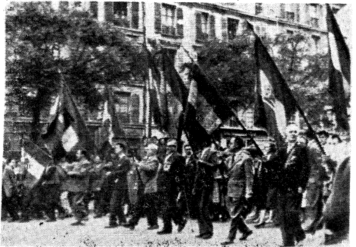
Partipolitikere demonstrerer mot de Gaulle før kapitulasjonen.