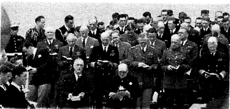
Verdenskrig til salmesang.

The Atlantic Charter ble omsatt i praksis gjennom