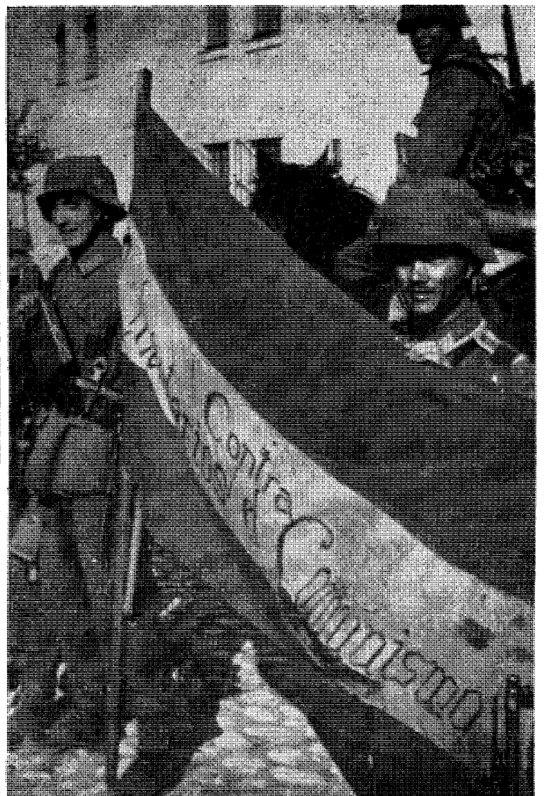
Soldater fra Den blå divisjon.