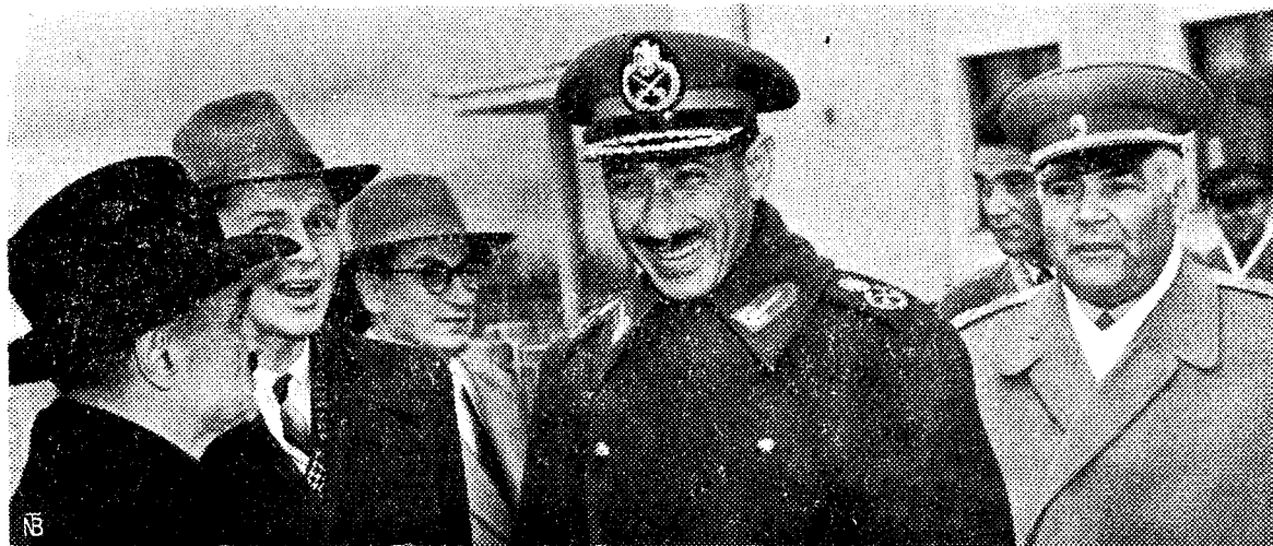
Vesten driver araberne over i Sovjets armer. Nassers nestkommanderende på besøk i Moskva.