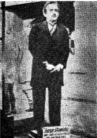
Bedragerens berømmelse kan måles ved at han har fått æren av å komme i vokskabinettet.

På side 4 begynner vi idag en uhyre morsom og fengslende skildring av denne makabre affære hentet fra en bok som vi tidligere har nevnt: «Hinter den Kullissen der Kabinette und Generalstäbe. Eine französische Zeit- und Sittengeschichte 1933-40» av Herbert Kranz.