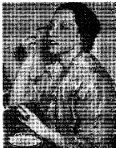
Fru Stavisky som revypike i USA etter sammenbruddet.

Hans hustru ser på ham, smiler til ham og tar litt av reddikene i den sure fløte. Hun er en ung kvinne av en egenartet skjønnhet. Ansiktet danner en smal oval, brynene over de lyse-