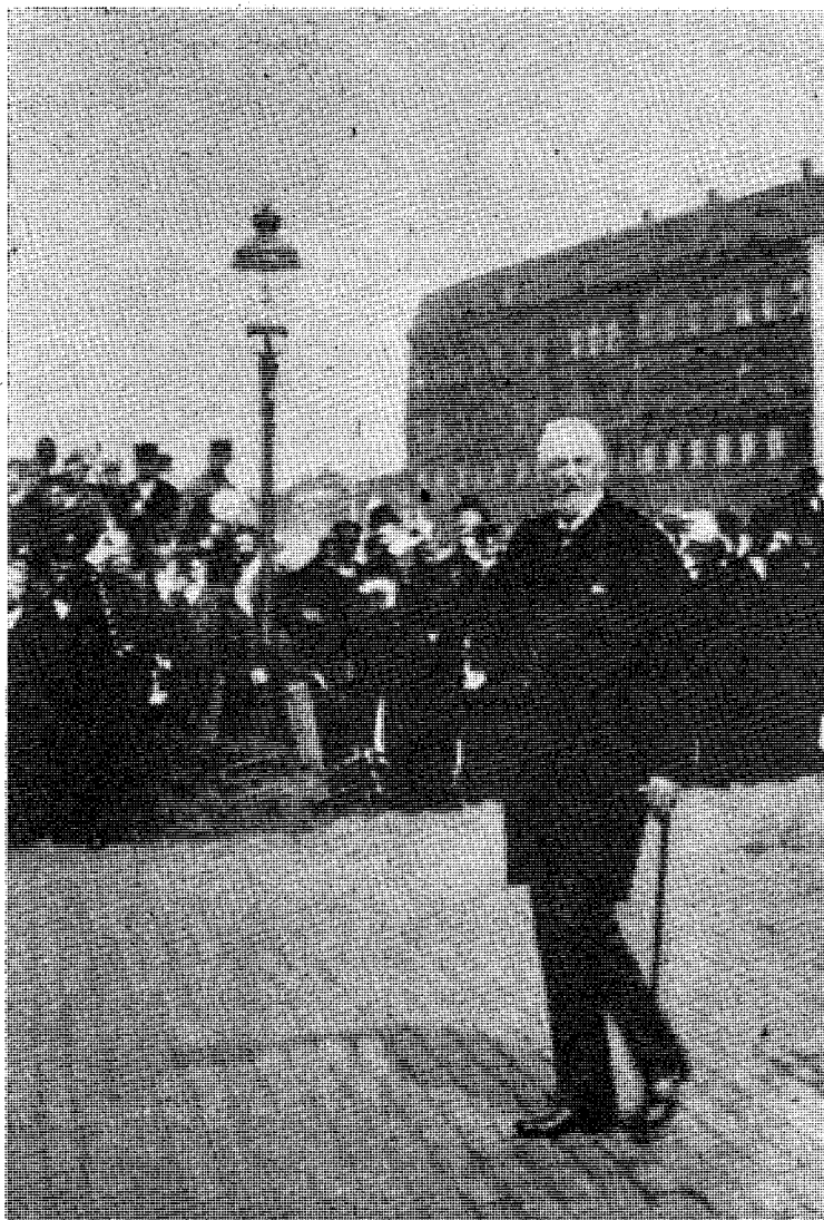
Avskjed med Nordens enhet — kong Oscar II fotografert sammen 1905. Illustrasjon fra boken «Kameraet forteller historie».

Vi blir presentert for denne første fotografikunst, denne første virkelige historie i bilder i den praktfulle bok «Kameraet forteller historie», som er kommet på Dreyers Forlag. Den inneholder et veld av utvalgte fotografier fra Krimkrigen til første verdenskrig, og forteller oss nesten alt om