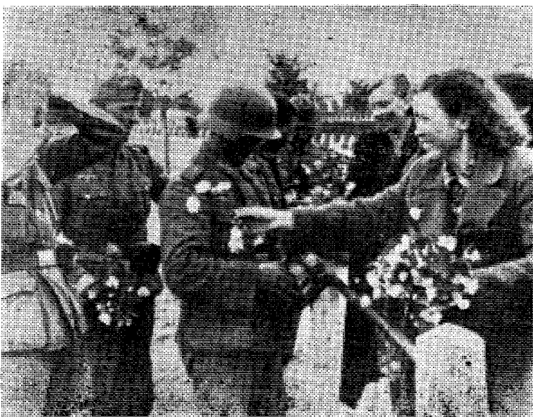
Tyske soldater ble møtt med blomster og jubel da de rykket inn i Lithauen.