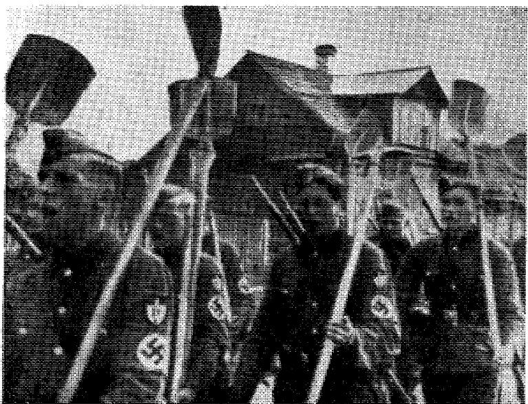
Det vilde ha vært enda flere av disse gode dukker hvis ikke noen hadde hjulpet til - - -