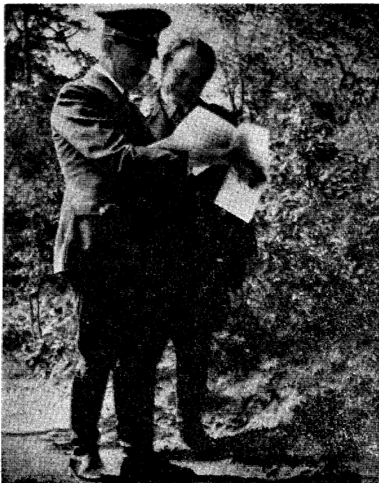
Adolf Hitler og Hermann Göring

Siden vil tyskerne være tilfreds med at de ikke ydet noe bidrag til en overlevelse av en foreldet tingenes tilstand, som verden i fremtiden ville funnet meget vanskelig å tilgi dem. Vi kan med sikkerhet spå en ting: Hvordan denne krig enn slutter, det britiske imperium er ferdig. Det er blitt dødelig såret. Det britiske folk står overfor en fremtid hvori det kommer til å dø av sult og tuberkulose på sin forbandede øy. England hadde jo fritt valg. Intet tvang det til krig. Og dog gikk det ikke bare til krig, men i virkeligheten fremkaldte det krig. Det er neppe nødvendig for meg å si at polakkene sikkert ikke hadde følt seg kallet til å begå selvmord, hvis de ikke var blitt drevet til det av de britiske og franske krigsmakere som selv var ansopret av jødene (I Sunday Express: «Who were themselves spurred on by the Jews»).