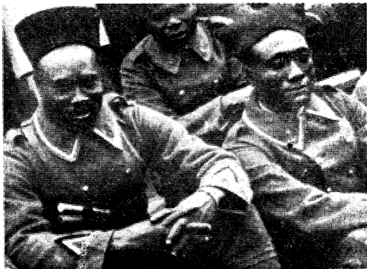
Fra den «franske» besettelse av Ruhrområdet etter 1. verdenskrig