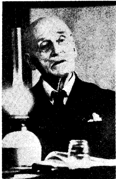
Knut Hamsun i retten

Undersøk, rettsindige læser, om denne fremstilling af aktionen mot Knut Hamsun er riktig, oppgjør dig en personlig mening og ta derefter alle konsekvenser!