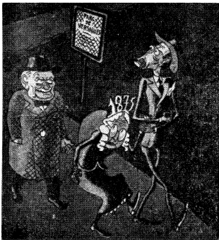
Da Doumergue i tredveårene tenkte på å gjøre det samme som de Gaulle senere har gjort, var Leon Blum den varme forsvarer av forfatningen av 1875. Det er Blums rolle som forsvarer av den avfaldige gamle dame karrikaturen fremstiller.

Vi hadde da sluppet den tyske okkupasjon. Vi hadde