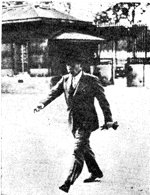
Sir Eric Phipps har det travelt —

«Hva for noe nytt? sier herr Reynaud, og anstrenger seg for å se uinteressert ut, for han vil ikke gjerne tilstå at han ikke er blitt meddelt siste nytt, skjønt han faktisk ikke vet noe.