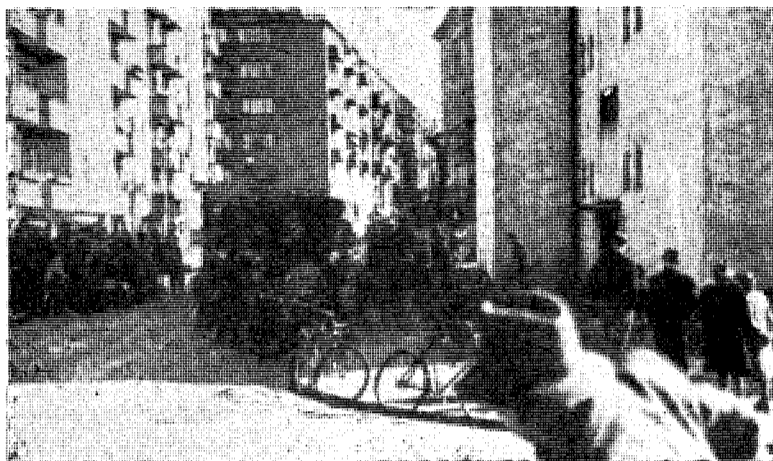
Heimefrontmord i Oslo.