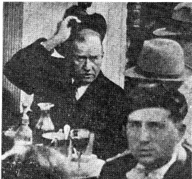
Missfornøyet Daladier ved absinten