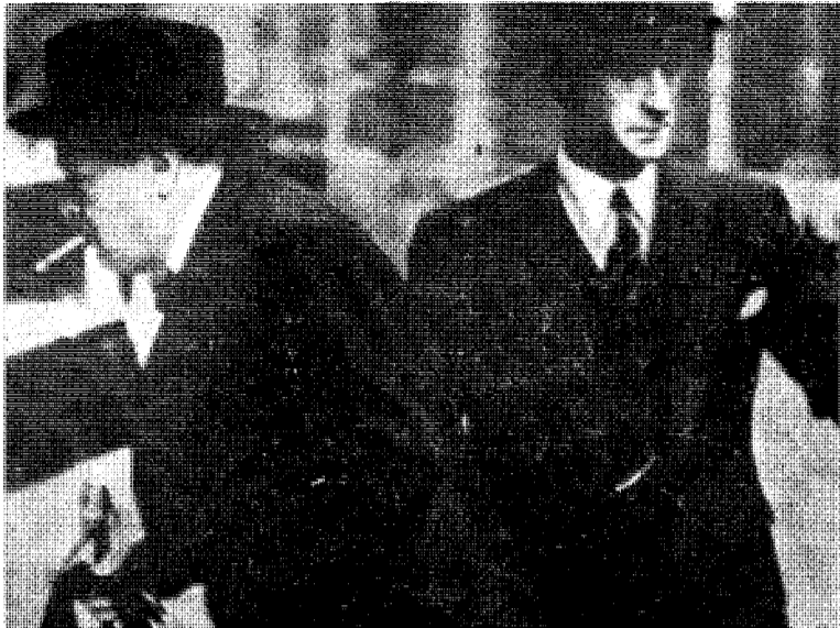
Churchill hadde hastverk — det tar på å drive krigshets —

Herr Mandel er kommet inn i justisminister Paul Reynauds arbeidsværelse. Ministeriet ligger dør i dør med Hotel Ritz ved Vandømplassen, men vender ut mot haven på den annen side. Mandel er som alltid svartkledd, tørr, en skarp forstand uten sjel. Reynaud kaster, som alltid når han er opphisset, hodet bakover og holder hendene krysset på ryggen slik at trøyen forskyver seg oppover.