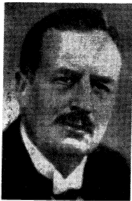
Sven Hedins vurdering av Adolf Hitler. Se side 2

Det heter om disse ting hos Kjelstadli på side 414 og følger: «Tyskerne mente å vite at den allierte bombing i Norge var upopulær. Ifølge Auswärtiges Amt/14072 av (Forts. s. 8)