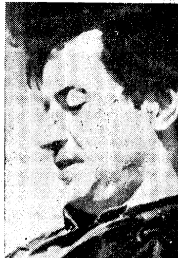
Forfatteren Jens Bjørneboe