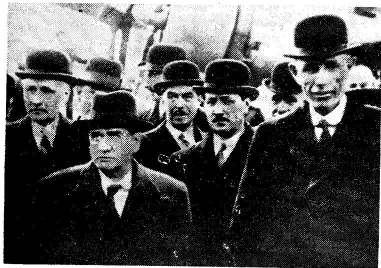
Bedrøvet ankomst i London, Daladier (tilv.) er kommet til Croydon, Londons flyplass og mottas av Lord Halifax (tilh.) Humøret synes å stå på null hos alle.