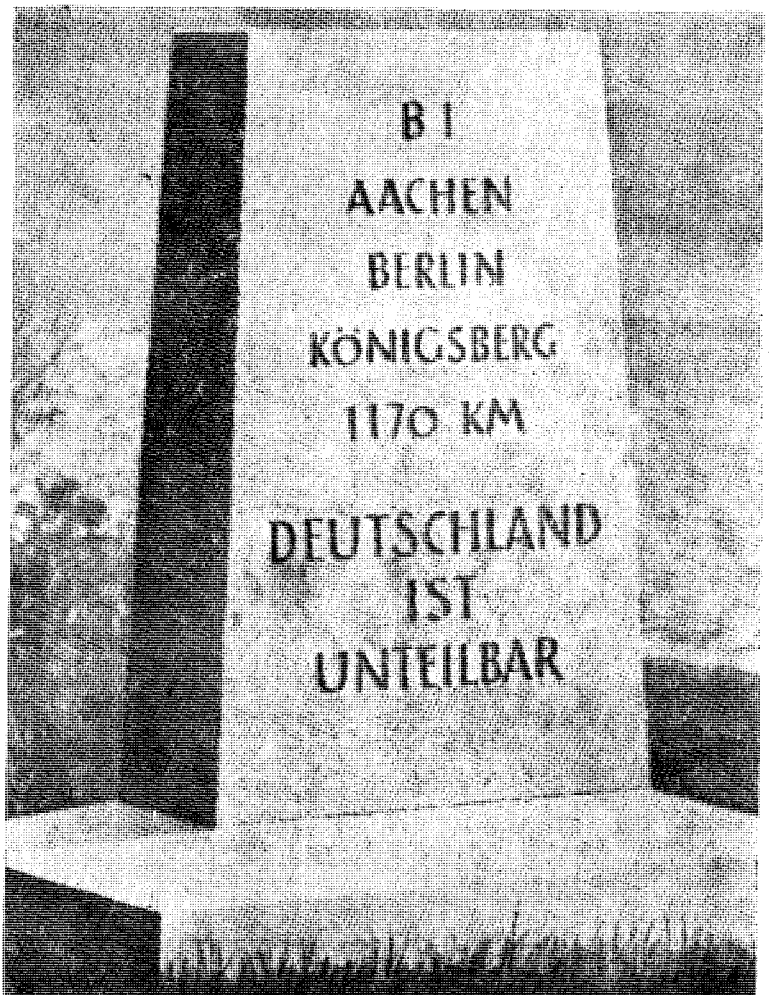
Et av de problem som Europa må løse før det kan bli fred og samarbeide