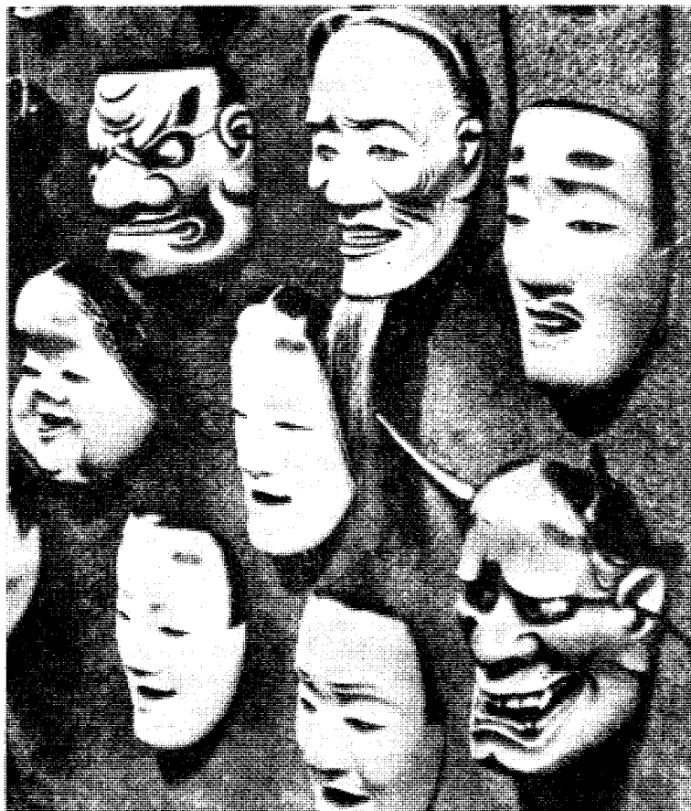
Eller en av de maskerte — — ?