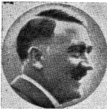
Var det han — — ?

I 1939 hadde tyskerne 106 divisjoner, mens franskmennene alene hadde flere, og dertil kom de polske styrker, som utgjorde 55 infanteridivisjoner, 12 kavalleri-brigader og to motoriserte formasjoner. Og ikke å snakke om Eng-