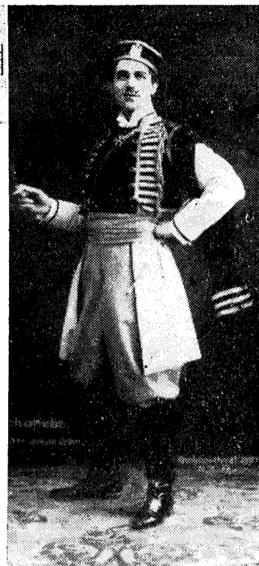
Også grev Danilo jobber idag for USA

Komponisten Richard Strauss arbeider post mortem som Knut Hamsun og Frantz Lehár for den amerikanske statskasse — de er alle USA's «fiender».