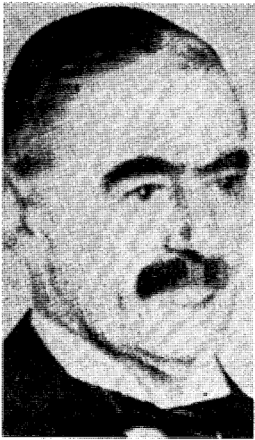
Neville Chamberlain, denne gang uten paraplyen

De tilstedeværende engelske ministre uttaler seg noe ubestemt, og Chamberlain innser klart at den franske plan er hjernespinnet og intet annet. Han sier høflig at dessverre må Storbritannia i før-