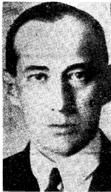
En av de brannfarlige: den polske utenriksminister Josef Beck

«Nation Europa», mener at den sanne krigsårsak er Englands og gulletts internasjonale eieres hat til Tyskland fordi det hadde gjort seg uavhengig av gullet og gulletts makt.