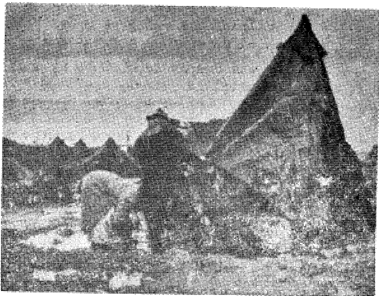
Slik bor araberne fra Palestina nå