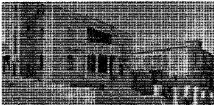
Araberboiger i Jerusalem okkupert av Israel.

Sovjet sortfarget, satelittstatene (unntatt Finland) skravert. Vesten hvitfarget.