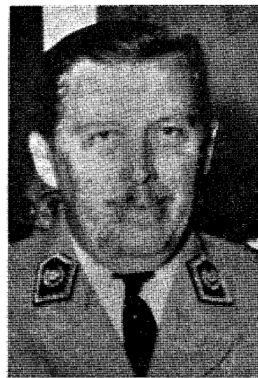
Står general Stroessner for tur?