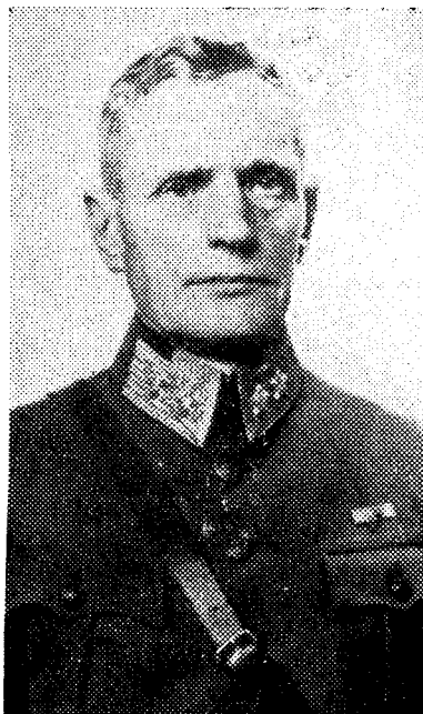
General Ruge. som stolte på engelsk hjelp.

Den engelske brigadegeneral Dudley Clarke skriver i sin bok «Syv oppdrag» bl. a. om begivenhetene i Norge i april 1940, hvor han gjorde