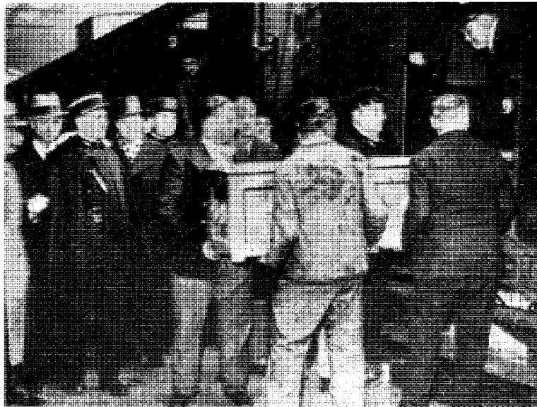
Staviskys kiste kommer til Paris

Lucette ser opp. Hva er det dyret har hørt? Da hører hun en svak lyd, som en gren skulle knekke. Hun ser i retning av lyden - og ser to mørke skygger i