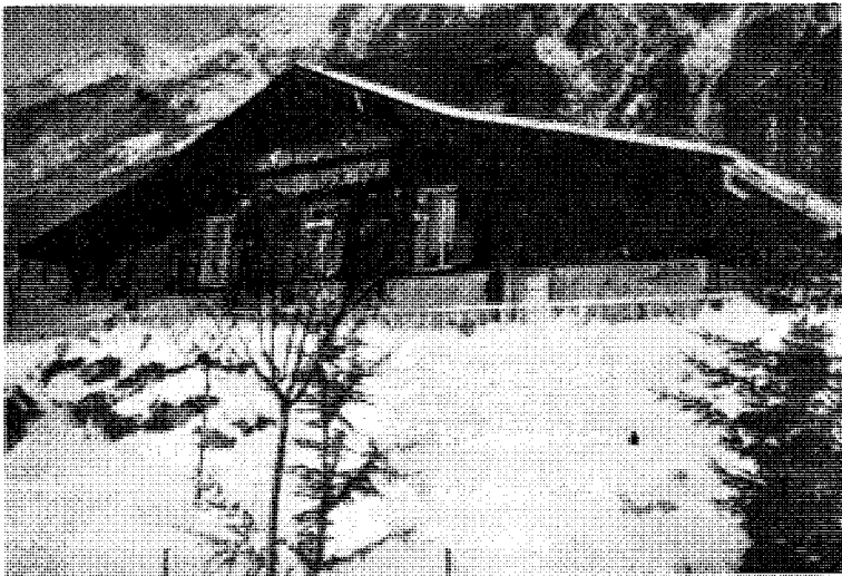
«Det gamle hus» i de franske Alpene hvor Stavisky ble skutt ned — av politiet?

Hver dag bringer den franske presse nye meldinger om den flyktede forbyrters formodede oppholdssted. Først meddelte Sûreté générale til beroligelse for publikum at en var på sporet etter ham, han holdt seg skjult i nærheten av Paris. Så blir det meldt at en hadde sett ham i Zürich og deretter i London. Og endelig blir det sagt at han allerede befinner seg i åpen sjø og på vei til Venezuela. Her synes politiet å være helt uten spor, og så har fiffige journalister oppsporet fru Stavisky. Hun hadde leiet seg inn på et billig hotell, Hotel Rue d'Obligado, men forlater det snart for å unngå fotografer og intervjuere. Isteden har det lykkedes avisene å oppspore en uekte datter av Stavisky, hvis biografi de nå bringer i de minste detaljer.