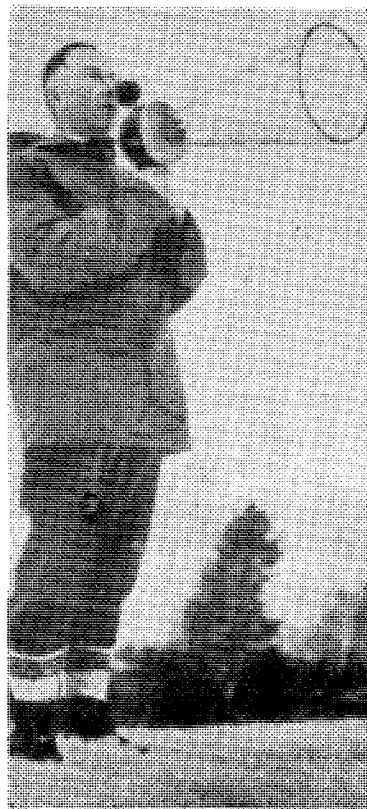
Berggrav var også oppe i Nordmarka — — —

Noen bemerkninger til et foredrag av Oslo Katedralskoles rektor