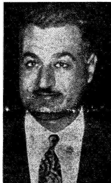
President Nasser, den arabiske nasjonalismens store mann

Denne holdning er så meget mere påfallende når en ser den i sammenheng med den syke holdning pressen inntar i spørsmålet om Sør-Afrika. Der er man en varm venn av «de stakkars innfødtes» selvstendighetskamp, tiltross for at de svarte der er like meget kolonister i Sør-Afrika som de hvite. Men når