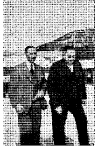
Bort fra ansvaret — — —

Hvem skulle nu utøve denne konstitusjonelle nødrett?