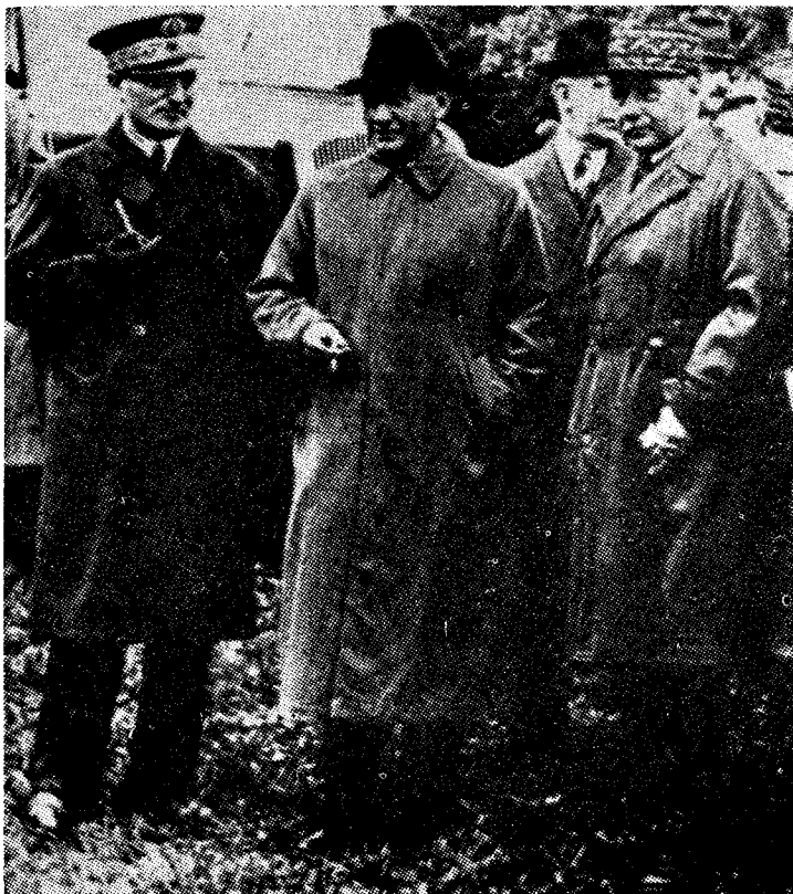
«Seirens treenighet» stod det som underskrift på dette bilde i en fransk avis i slutten av 1939. Daladier er i midten, med Gamelin lengst til høyre og admiral Darlan lengst til venstre.