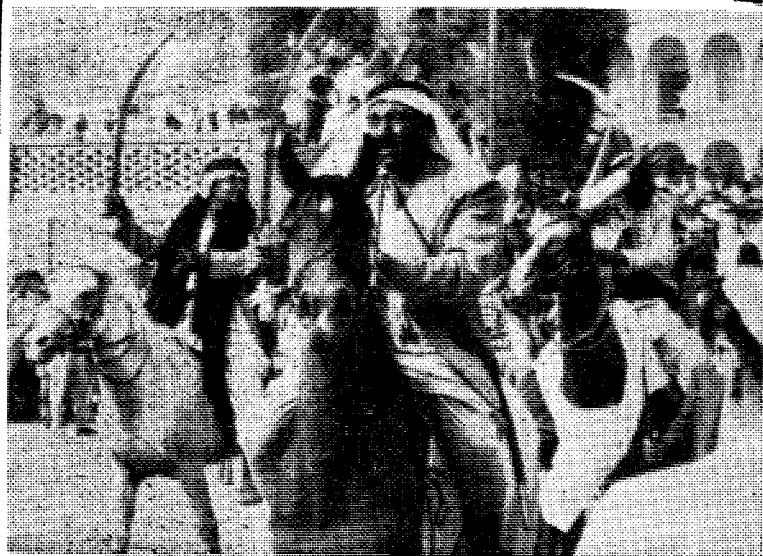
I araberstatene møtes gammelt og nytt