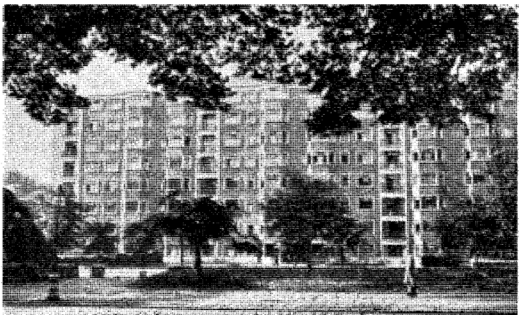
Herfra «ble den konstitusjonelle nødrett» utøvet ifølge Høyesterett: Kingston House ved Hyde Park. Her holdt alle de «norske» departementene til, samt Norges Bank, «Stemmen fra London» og meget annet.