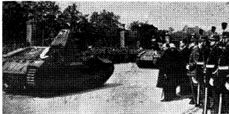
Daladier besiktiger sine stridsvogner. Hans efterfølger Reynaud sa riktignok senere at «stridsvognene befant seg for størstedelens vedkommende på papiret».

Ved dette besøk, som han har fortalt utførlig om i et amerikansk ukeblad («Saturday Evening Post»), skulle Romaines opplevde enda underligere ting. En time før han var tilsagt hos Gamelin, holdt en automobil med en soldat som sjåfør foran huset hans. Romaines antar at turen vil gå til Vincennes, for der er etter hva han vet hovedkvarteret i et gammelt slott — men bilen tar en ganske annen vei. Så får han igjen inntrykk av at han kjører til Vincennes, bare med mange kroker og svinger som for å føre eventuelle forfølgere på villspor. Nå går det bortover en tett allé, bilen stopper, i mørket kan ikke Romaines se hvor han er. Han stiger ut og blir ført av en soldat til en dør, som straks lukker seg igjen.