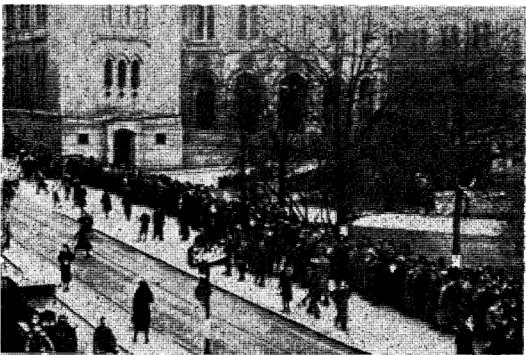
Om styresmaktene intet skjønnte, så forstod iallfall mange av de menige at katastrofen nærmet seg: Kjø foran Stortinget om eftermiddagen 8. april — på et tidspunkt de regjeringen fremdeles nektet ethvert militært tiltak.