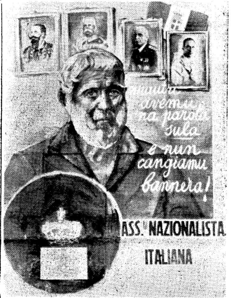
En av plakatene fra A. N. I.