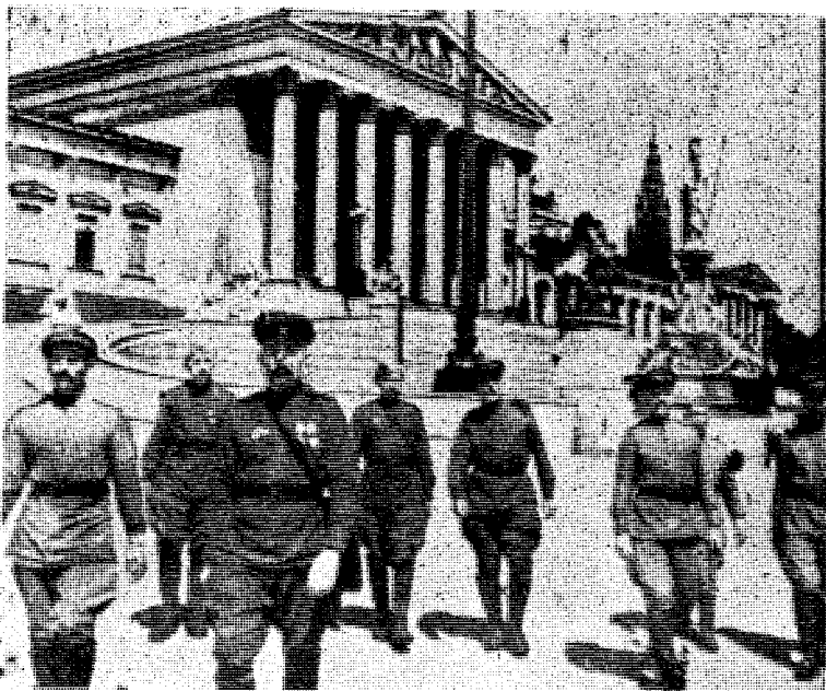
De røde installerer seg i Wien for å forhandle om nye utleveringer.