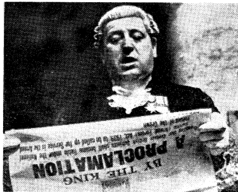
Mannen i parykk leser en proklamasjon fra kongen, som kaller alle engelskmenn mellom 19 og 36 år under fanene. Bildet er tatt 9. mai 1940.

Den erfarne kirurg er også menneskekjenner. Han lar seg ikke bruke som medhjelper ved et moralsk fluktforsøk. «Nei, langtifra», sier han, «om otte dages tid er De isving igjen —» (Forts. side 7)