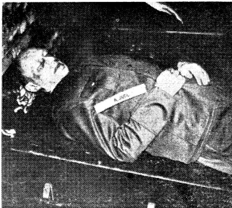
Kort tid etter at general Jodl gav disse opplysninger om Adolf Hitler ble han hengt av seierherrene. Døds-kampen varte i femten minutter, sier det svenske øyenvitne.