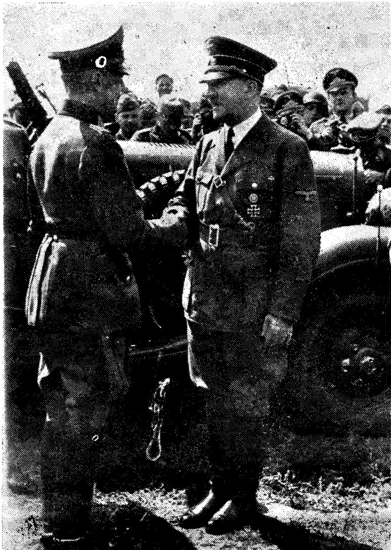
Den militære leder Adolf Hitler sammen med general v. Rundstedt

Der Führers plan for felttoget i vest kan i storhet i anlegget siestilles med den berømte Schlieffenplan.