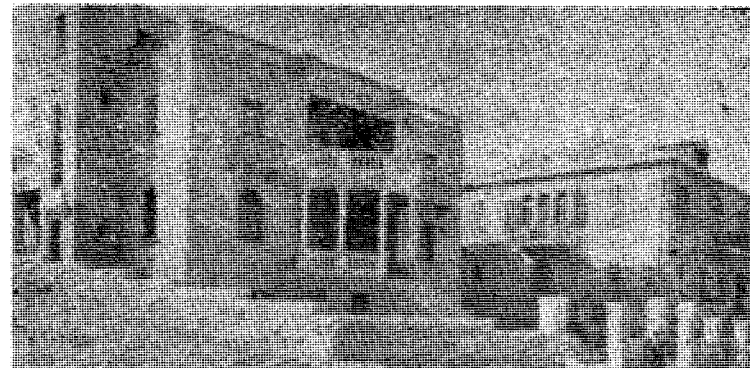
Araberhus i Jerusalem som jødene har bemektiget seg.

Pussig intervju med jordansk kvinnelig FN-stipendiat som raser over de israelske overgrep