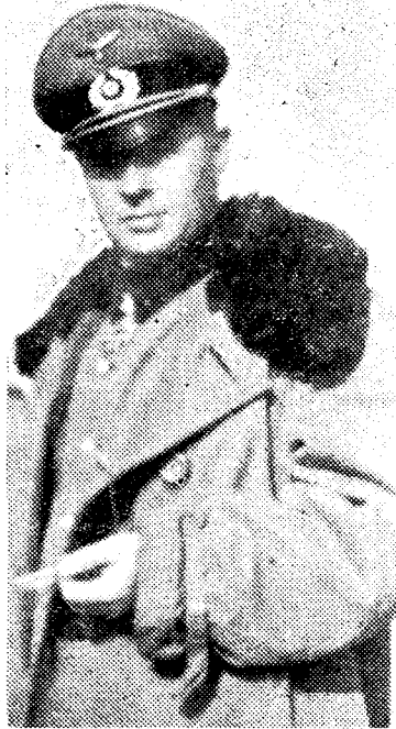
Generalløytnant v. Pannwitz som lot seg utlevere til bolsjevikene sammen med sine kosakker og som ble hengt i Moskva.