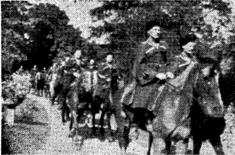
Kosaker som kjempet mot de røde og som ble utlevert av amerikanerne og britene.

En flagger og fester for så meget nå for tiden, så hvorfor ikke ofre litt tid også på minnet om noen millioner ulykkelige mennesker som amerikanerne og britene under kommando av general Eisenhower utleverte til de sovjetiske bødler, de samme som nå har sin store moro av disse tåpelige nydemokrater som forhandler seg lenger og lenger mot avgrunnen. Det er vår svenske kollega «Fria Ord» som trekker frem disse hendelser for femten år siden, forøvrig uten å nevne at også svenskene deltok i dette forrederi mot antikommunismen, for Sverige leverte jo selv ut de balter som hadde søkt tilflukt på nøytralt område. Men svenskene om det. Vi gjengir her hva «Fria Ord» skriver om forbrytelsen for 15 år siden: