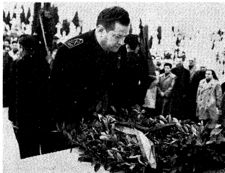
Kransepålegging på kirkegården i Valladolid for de myrdede falangiststudenter