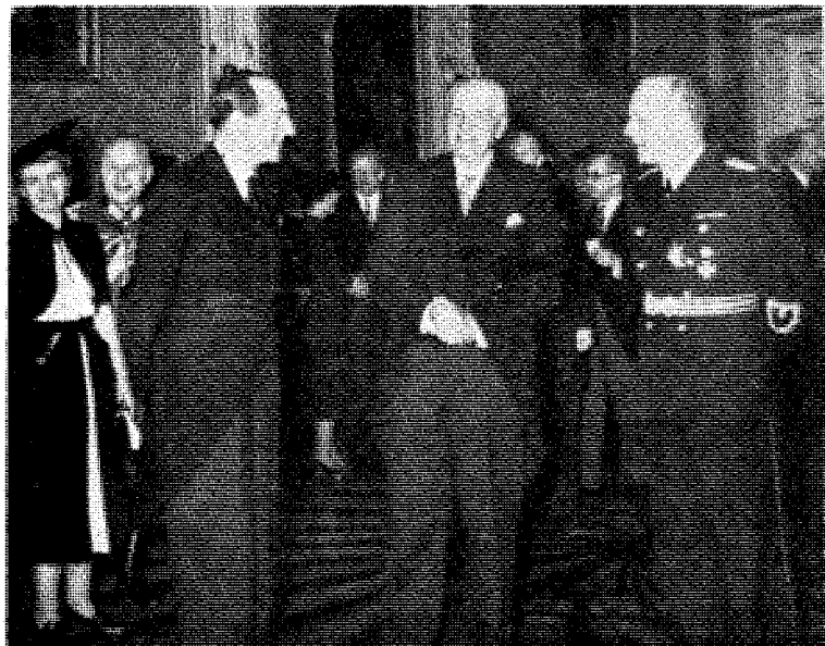
Utenriksminister Ribbentrop i samtale med den polske president Moscicki og utenriksministeren oberst Beck.

Alle nasjonale bevegelser må derfor beskjefte seg med jødespørsmålet, men derfra er det et langt skritt til vold og utryddelse. Det har iallfall aldri vært snakk om noe slikt