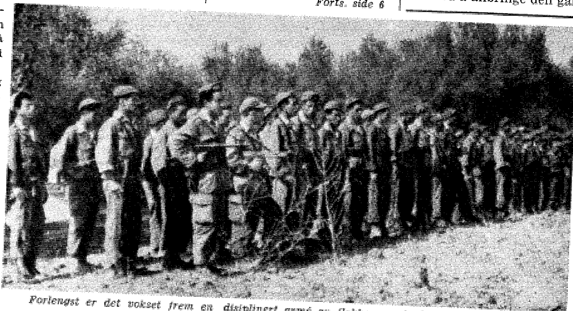
Forlengst er det tattet frem en disiplinert armé av flokken med algirske frihetskjemperne