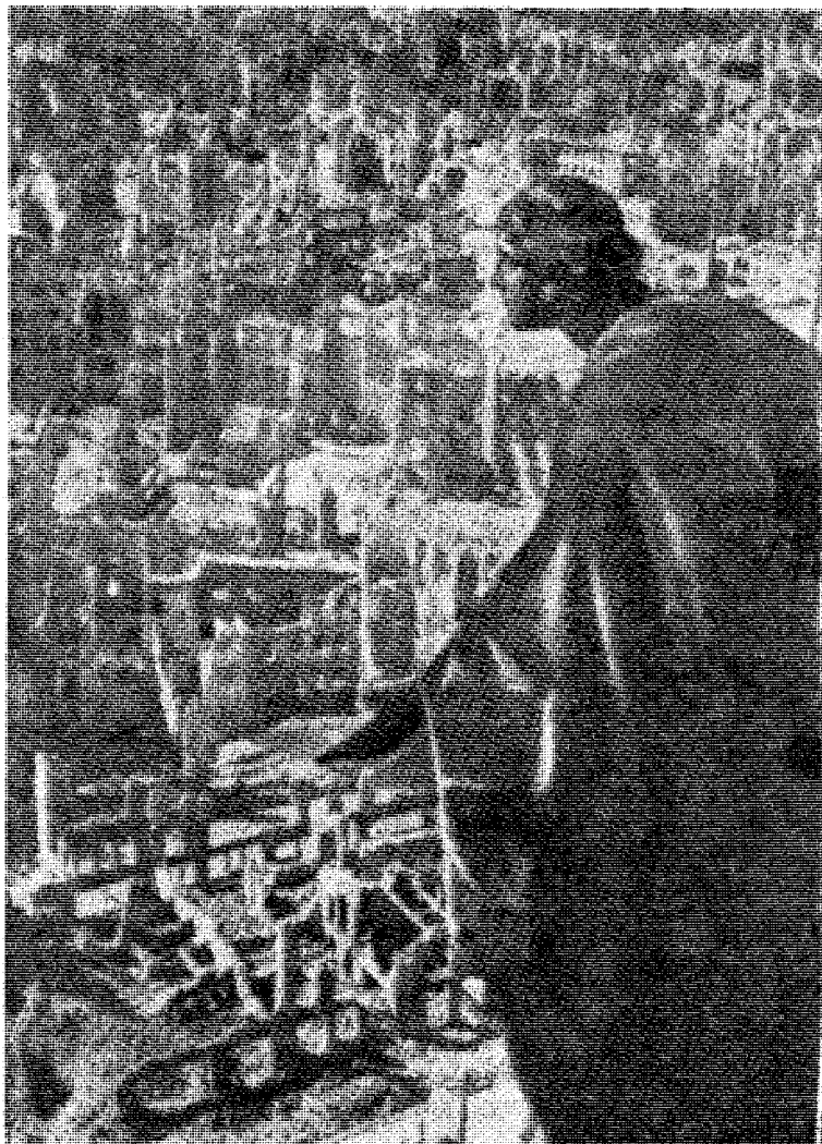
Bildet fra det utbombede Dresden har vi hentet i det svenske blad «Fria Ord», som også gjengir artikkelen i «Vi».