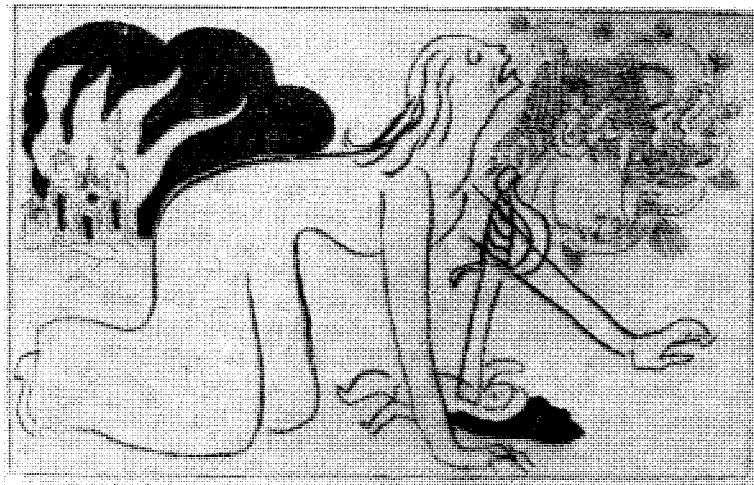
Propaganda for England i første verdenskrig. Vi kjenner igjen metoden.

Vi fortsetter fra nr. 38 —39 skipsfører Dalhs historisk interessante beretning fra 1. verdenskrig om britenes og deres hjelpsmenns propaganda mot tyskerne.