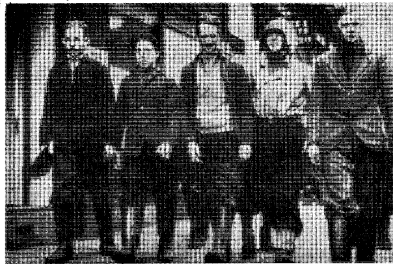
Fiskergutter fra Lofoten ser seg om i verdensbyen