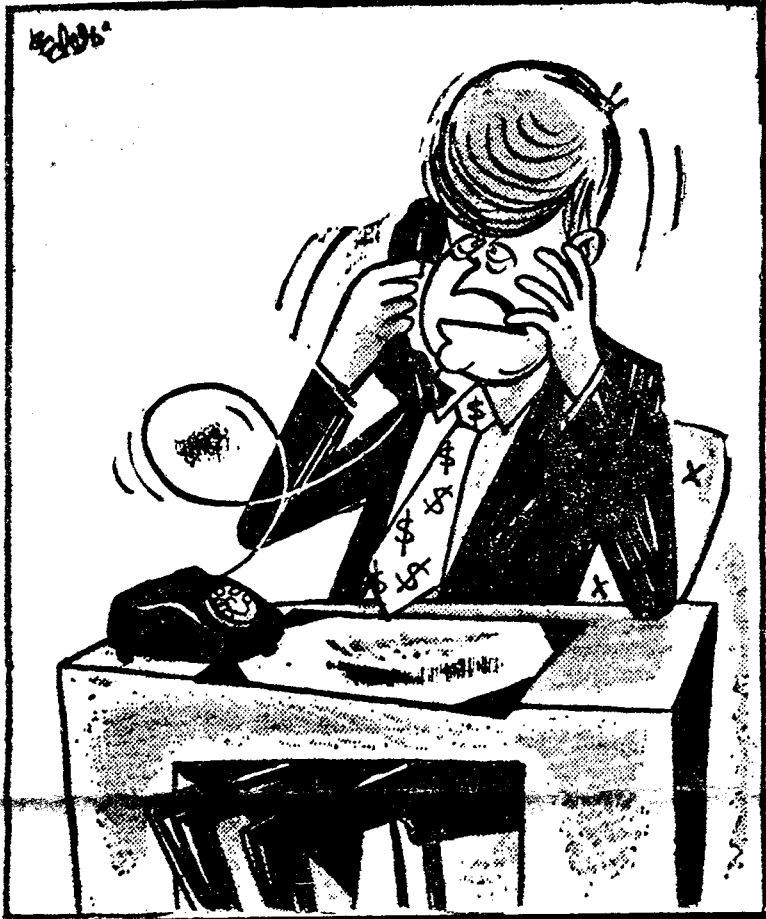
Også FRIHETEN bringer imellom noe godt. For eksempel denne, med underskriften: «Kennedy: Storbritannia — er ikke det en av Fords avdelinger?»