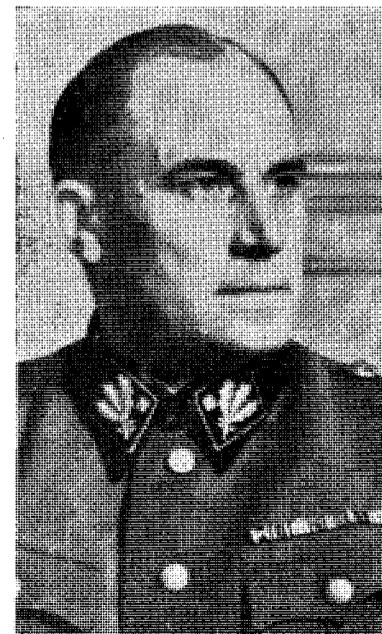
Politigeneral Rediess hevdet at flyktingene til England stod i en annen stilling enn de til Sverige