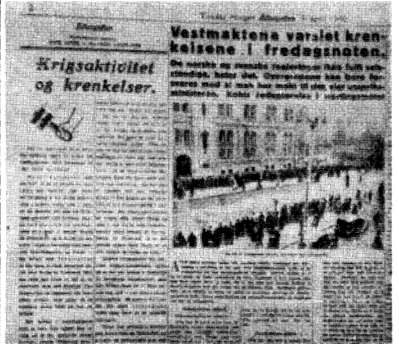
— — ledsaget av en til formålet passende kunngjøring».

«De sannheter som vi aller mest trenger å kjenne». (Kinesisk ordsprog)