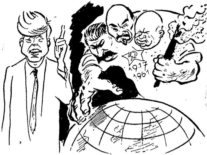
Kennedy: «Vi ser oss stillet overfor en usedvanlig utfordring». — Mange er sene i oppfattelsen, kommenterer Deutsche Wochen-Zeitung»

II. Renkespill om Asia som bakgrunn for dagens Laos-konflikt