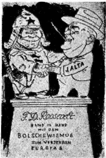
Utkast til nytt Roosevelt-monument på Skansen

Påny og påny, mens det noterer runden av diploma-