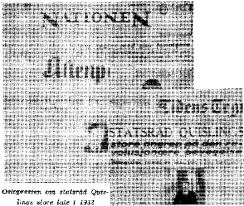
Oslopressen om statsråd Quislings store tale i 1932

Men av de samme grunner ble Quisling mere bannlyst enn noensinne av arbeidergruppene og de liberale, og krav om at han skulle gå av kom fra Arbeiderparti- og kommunistrepresentantene i stortinget. Han holdt imidlertid stillingen, og med en stor bunke dokumenter, som omspente perioden fra 1918 til 1932, i sine hender, talte han til stortinget, idet han beskyldte lederne for de radikale elementer for å stå direkte under ordre av Moskva, hvis formål blant annet var å opprette en sovjetrepublikk i Nord-Norge og å danne kommunistiseller i hæren og marinen.