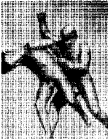
Vestens historie de siste tyve år.

Der drives i denne tid en svær propaganda for å banke inn i oss at vi bare har livet tillåns og at menneskehetens undergang er sikker den dag det engang smeller. Propagandaen tar åpenlyst sikte på å gjøre oss vettskremte, møre og vel skikket til å følge mottoet «heller rød enn død», og det forsikres under meget skrå at Vesten aldri har stått overfor en slik fare som den der truer oss idag.