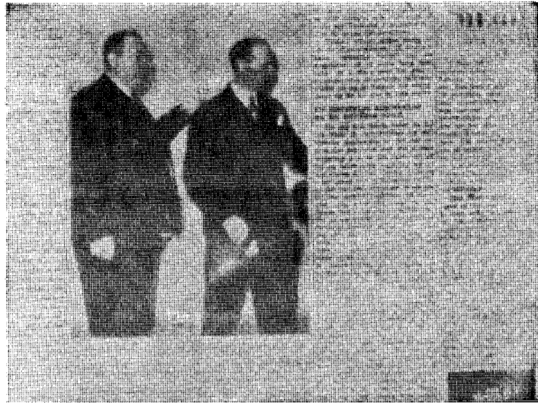
Aftenposten presenterer pasifisten statsminister Nygaardsvold og hans jagmilitære forsvarsminister Ljungberg — en bedrøvelig ledelse da England presset oss inn i krigen.

Det skulle ligga nära till hands att skylla detta sakernas tillstånd, som ju på det omhyggeligaste sätt skulle hämnas sig i april 1940, på arbetarpartiet, vilket satt vid regeringsmakten sedan 1930-talets mitt. Till en viss del är detta naturligtvis riktig. Om arbetarpartiets ledning hade ønskat en bättre beredskap, hade den når som helst kunnat driva igenom de erforderliga besluten med en förkrossande majoritet i stortinget, eftersom varje sådant forslag skulle ha fått stöd från både högern och bondepartiet. Det är