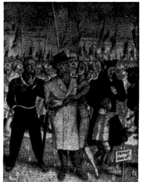
Plakat fra okkupasjonstidens siste del, som synes å bli aktuell igjen. «Befrielsen» stod det som overskrift.