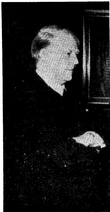
Det det kommer an på er å kjenne sin tid og ville det gode —

Han ble imidlertid på den mest ondskapsfulle måte raket ned på av de liberale, arbeiderpartifolk og kommunister i deres tallrike presseorganer og i taler og fremstillet som en fascistisk undergraver av demokratiet og landets frihet. Han var ikke engang trygg personlig når han var ute på foredragsreiser, idet man lå i bakhold etter ham og han ble fysisk mishandlet til og med i Forsvarsdepartementets kontorer. De kommunis-