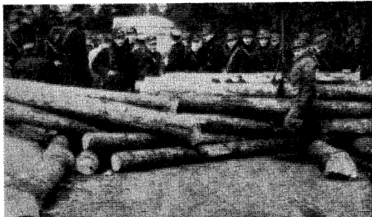
«Det i realiteten så gott som forsvarsløse Norge»