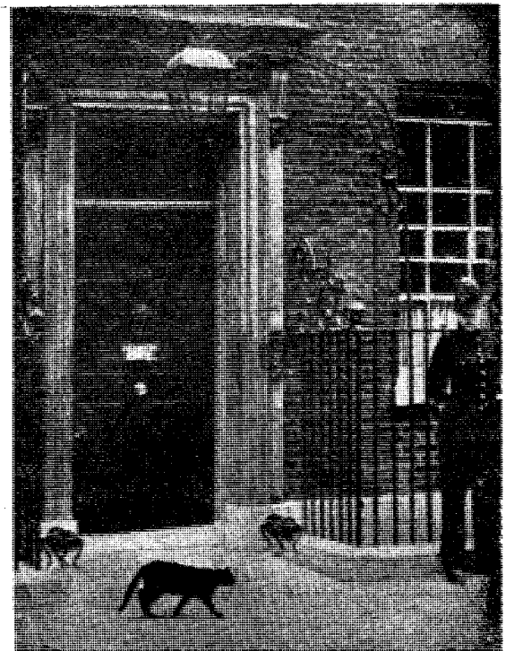
Downing Street nr. 10 hvor også Norges skjebne har vært og tyvensynlig fortsatt blir avgjort.