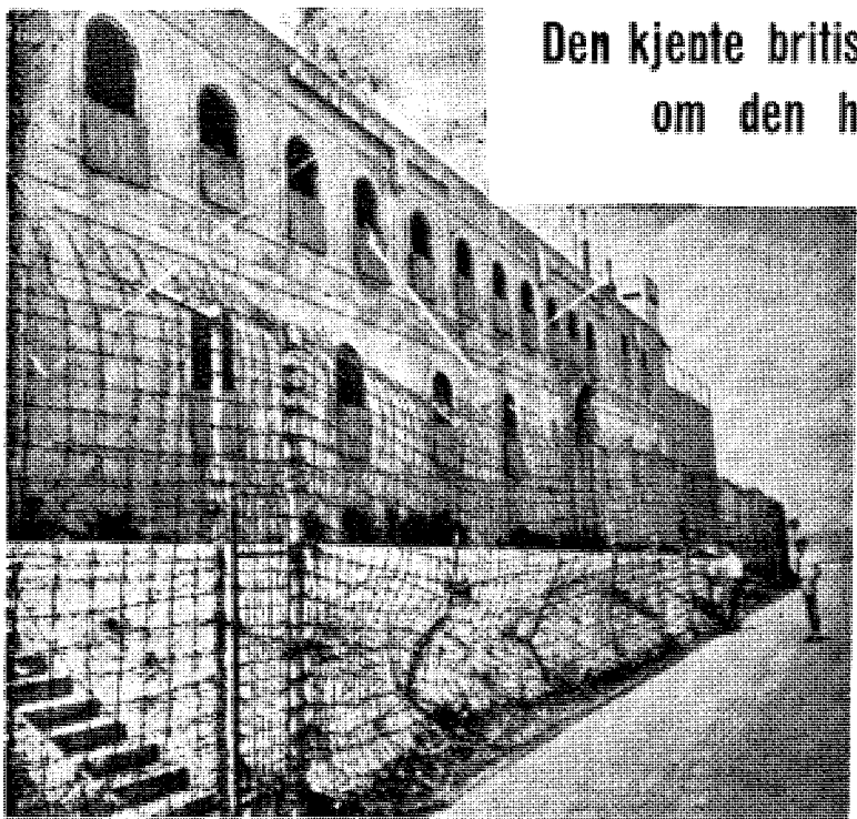
Dette er fengslet hvor Eichmann forberedes for «rettssaken». Han får ikke snakke med sin forsvarer i enerum og under den såkalte prosess skal han sitte i et eget bur tilbygget rettssalen, slik at ingen kan komme i kontakt med ham. Pussige forholdsregler etter vesteuropeisk målestokk.