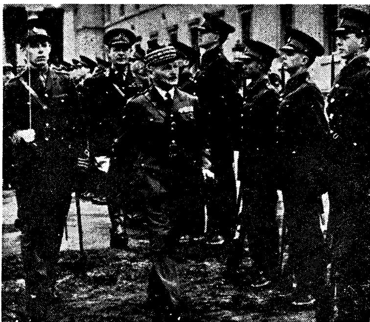
General Weygand i England. Inspiserer militærskolen i Sandhurst, ledsaget av den meget omtalte Lord Gort.