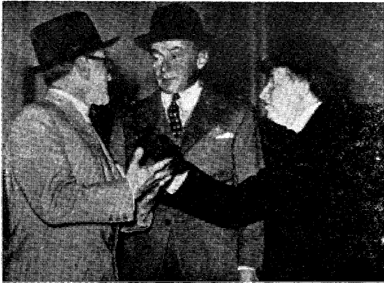
Tre sammensvorne i samtale: til venstre marineminister Champanchi, i midten ministerpresident Paul Reynaud, til høyre minister Mandel.

Mens generalen talte hadde ministrene uavbrutt sett på marskalk Pétain. For hva er det bunn og grunn annet enn politiske taktikere, som i hele sitt liv, fordi de forstod den franske innenrikspolitikkenes spilleregler, foregjølet landet og seg selv at de var politiske førere. Nå under skjebnens harde slag blir de til intet, som papir i en flamme. Ansikt til ansikt med generalens knusende redegjørelse søker de hjelpeløse ministre redning bak marskalkens autoritet — men han bare nikker til Weygands fremstilling og fratar