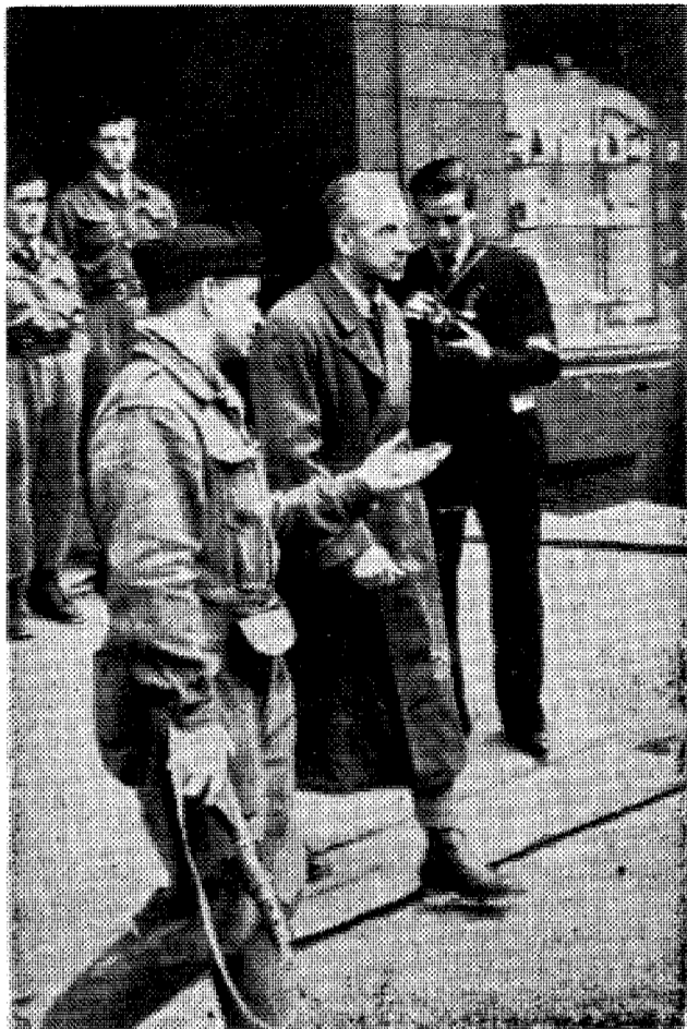
Eiendommelig nok glemmer han justismordet på sine forbenværende kamerater og meningsfeller

Den franske jøde Alfred Dreyfus ble i 1894 dømt til livsvarig forvisning til Djeveløya ved Cayennekysten for angivelig å ha drevet spionasje for en fremmed makt. I 1899 ble saken tatt opp igjen, ikke minst takket være den helstøpte oberst Picquart, og da ble Dreyfus dømt til 10 års festsingsarrest. Men det ble ikke ro om dette «retts»oppgjør, like lite som det blir ro omkring lignende misbruk av rettspleien, hvor makt gjøres til rett. I 1906 ble så Alfred Dreyfus endelig blankt frifunnet og ble gjeninnsatt i sin stilling i hæren med majors rang. Dertil ble han ridder av Æreslegionen. Det er ikke tvil om at bak dette justismord var det engasjert en god del jødehat, kalt antisemisme, hvilket begrep er misvisende, da jødene er de største antisemitter i sitt fiendtlige forhold til araberne, som er vaskeekte semitter i motsetning til jødene. Disse er i stor utstrekning khazarer, som ifølge samtlige konversasjonsleksika er av turansk ætt i slekt med tyrkerne.