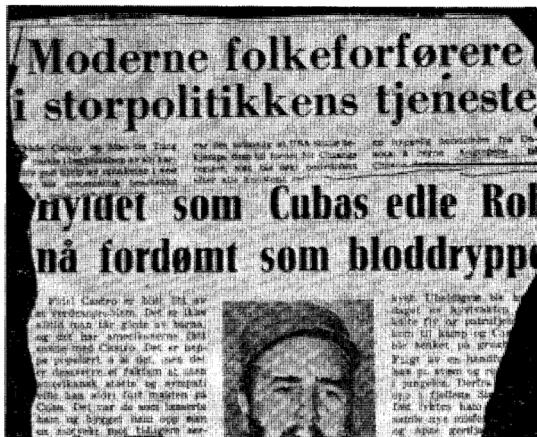
De kommet efter

MORGENBLADETS artikkel omhandler i første rekke den skandaløse politikk som USA har ført i Kina, et emne som ikke vil være ukjent for dette blads lesere siden vi har behandlet det om og om igjen og påvist hvor katastrofalt det er å lenke sin skjebne til en slik politikk. Vi har pekt på det ansvar det amerikanske utenriksdepartement og den i Norge meget oppskrytne general Marshall har for elendigheten. Men har MORGENBLADET sagt fra før nå da ulykken er der og ikke kan rettes på? Har ikke