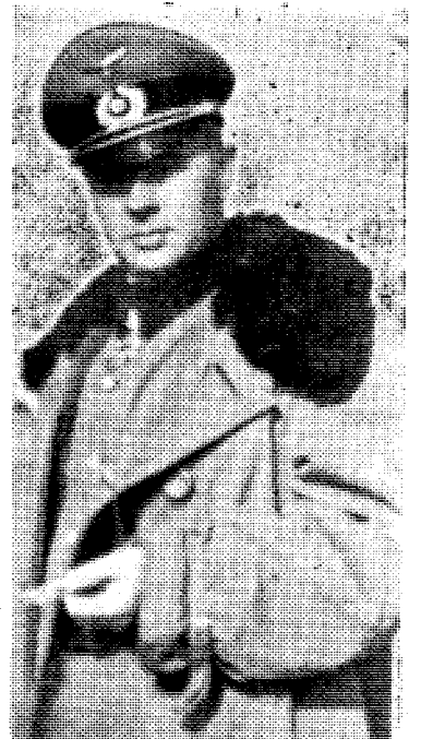
General v. Pannwitz.