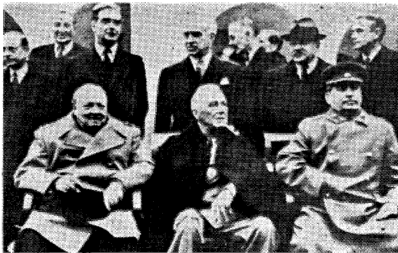
Dette burde vært et bilde fra tiltaleboksen i Nürnberg, men viser «de tre store» i Jalta