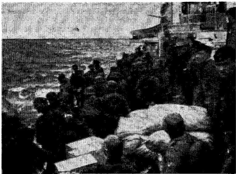
Tyske soldater landsettes ved Narvik