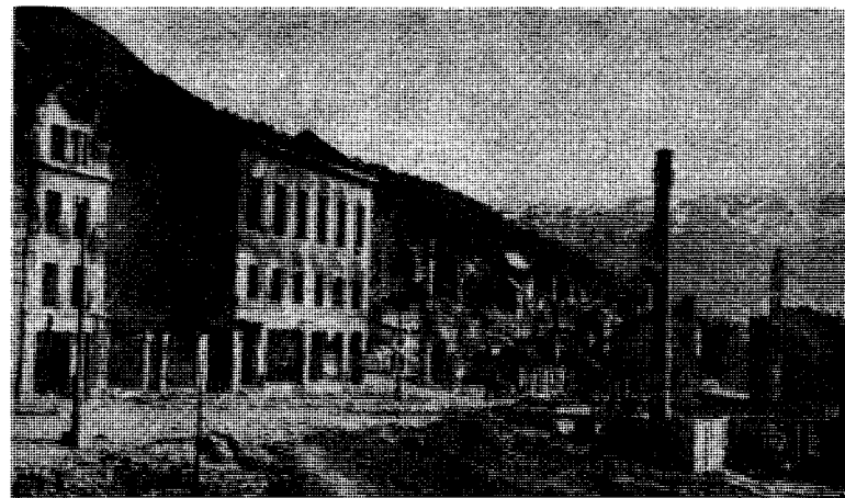
Narvik berjet av krig og brann.