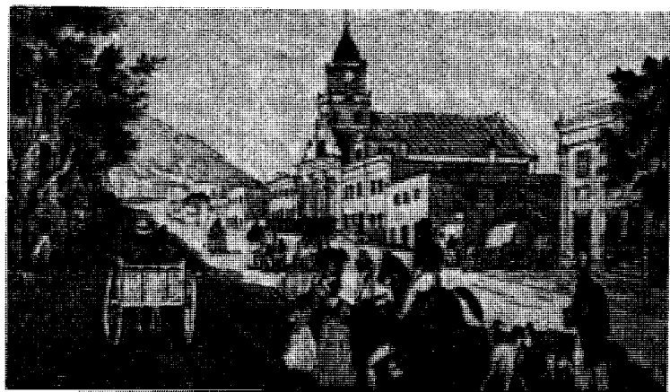
Gammel tegning fra Kap.

Men hvis tanken bare var å hjelpe Finland, hvorfor skulle så Stavanger besettes?