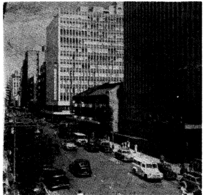
Fra Johannesburg i dag.