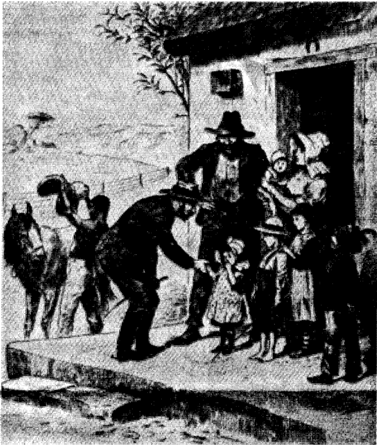
Boere efter en tegning fra århundreskiftet.

EN BERÅTTELSE OM HÅSYNSLØS IMPERIALISM OG OBÄNDIG FRIHETSVILJA