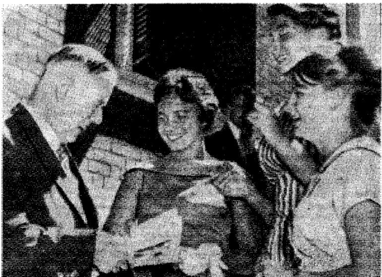
Ministerpresident Verwoerd og Sørafrikas unge hvite generasjon. Som alle kan se er det blod av vårt blod.