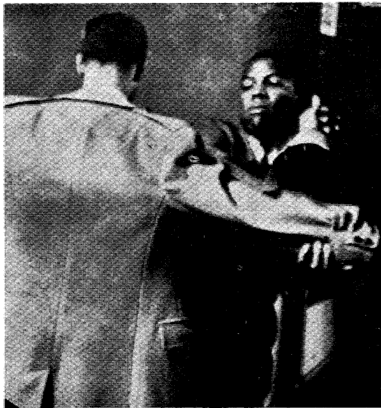
En av «Islams sorte frukter» kroppsvisiterer en hvit journalist som har fått lov til å overvære et møte.

Med «The Black Muslims» dreier det seg om åpen svart rasekamp rettet mot «de hvite djevlere». De er motstandere av enhver form for integrering, pålegger sine medlemmer å ha bare den aller nødvendige omgang med hvite og driver sine egne forretninger og restauranter. Deres krav er i første omgang å få overta endel av