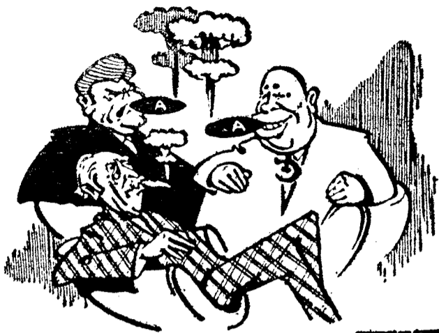
Atomkraftens enighet om stans med prøvene fremstiller vår kollega FRIA ORD slik: «Monopolcigarrer i eksklusiv herrklubb».

Angelsakserne er opprinnelig en folkegruppe som kommer fra det europeiske kontinent. Omkring år 900 utvandret de til England. Angelsakserne i England ble i året 1066 undertrykket av det nordisk-galliske folk normannerne. Disse var katolikker og autoritært innstillet.