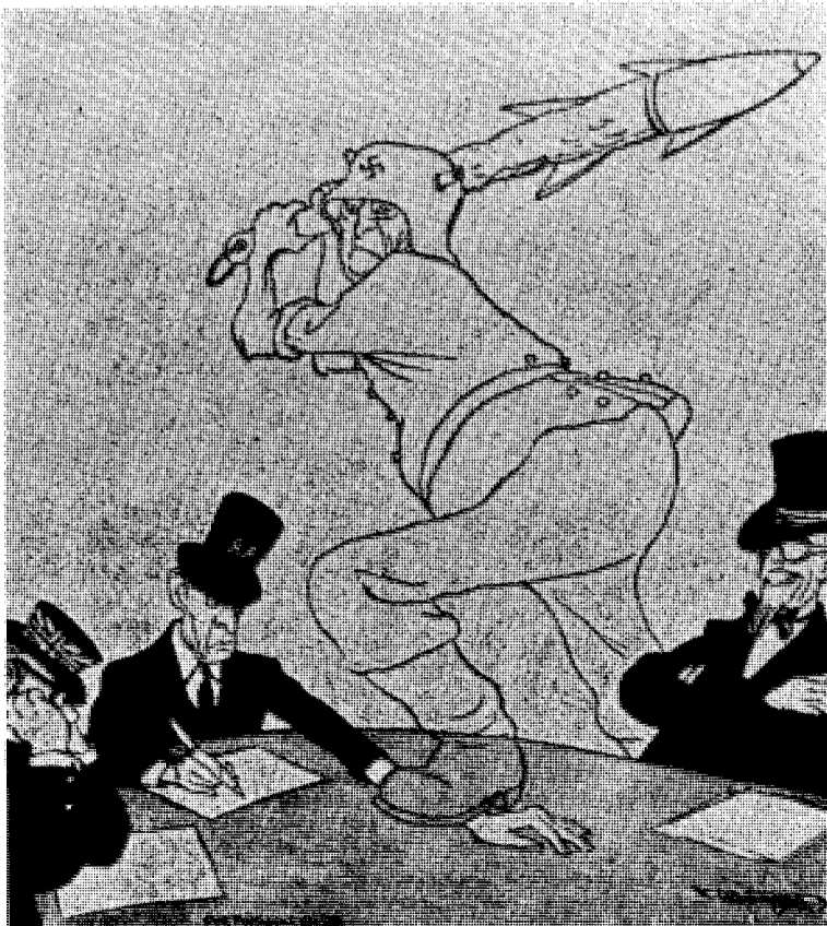
Allehånde partidemokraters og statsmenns onde drøm.