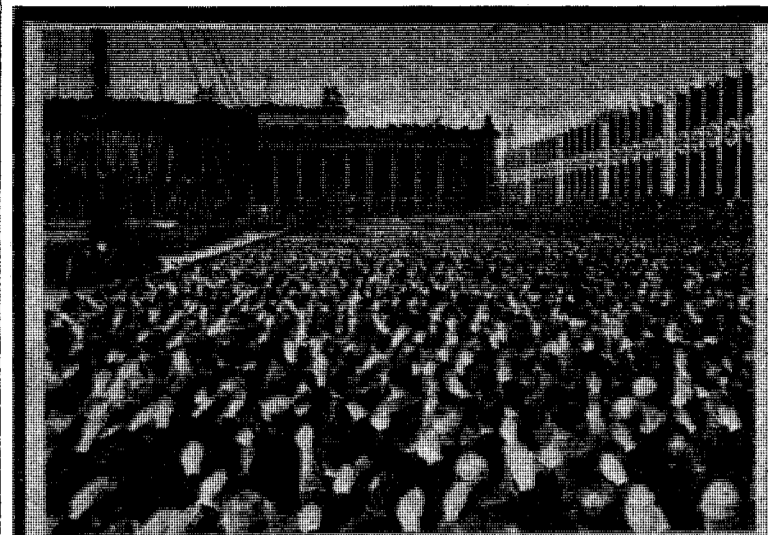
En bild från nazistpartiets och nazisternas glädjedagar i Berlin.