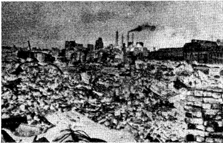
Det de allierte bombefly ikke hadde klart å ødelegge, det ordnet allierte sprengkommandoer. Store fabrikker som gav arbeide til titusener ble jevnet med jorden.

En kan naturligvis ofte lure på hvorledes Tyskland kan ha blitt slik som det trer frem for oss idag i aviser og tidsskrifter, i radio og fjernsyn. Dette Tyskland som bare for tyve år siden så å si enstemmig og begeistret sluttet opp om Det tredje rike.