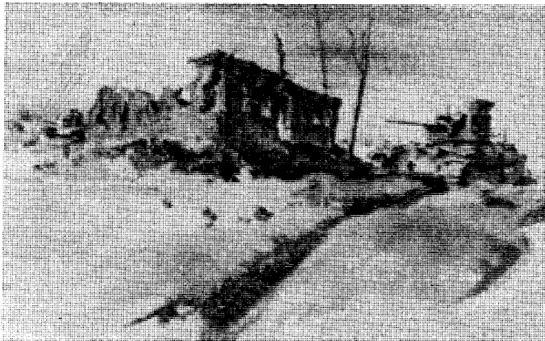
«Die rote Schule», Pulikova ved Leningrad.

«Nei!» — «Har dere håndgranater nok også?» — «Det holder!» — «Hold ørene stive og på gjensyn! Husk at vi ikke kan hjelpe dere hvis Ivan angriper, vi kan ikke løpe over isen uten dekning. Så pass godt på!»