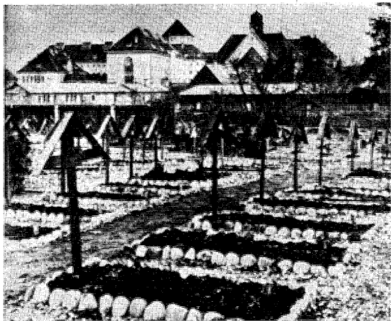
I Landsberg, i Werl og andre steder vokste gravrekken for de av de allierte henrettede tyskere. I bakgrunnen det beryktede Landsbergfengslet