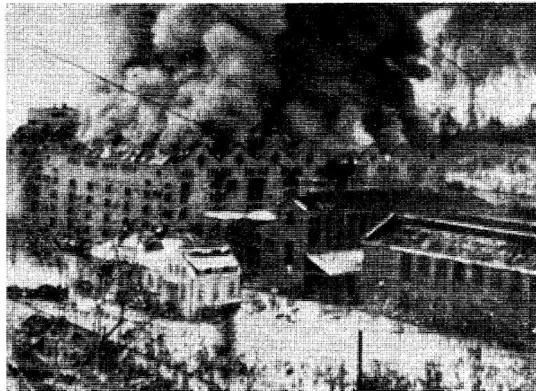
Bombingen på Rjukan i november 1943.