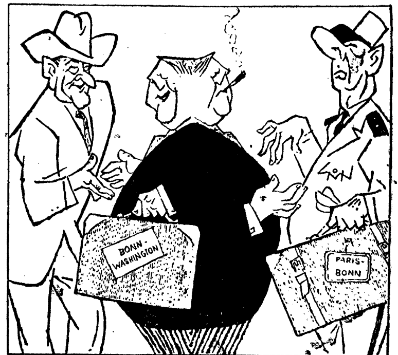
Erhard ambulerer mellom USA og Frankrike. Slik ser NATIONAL-ZEITUNG DET