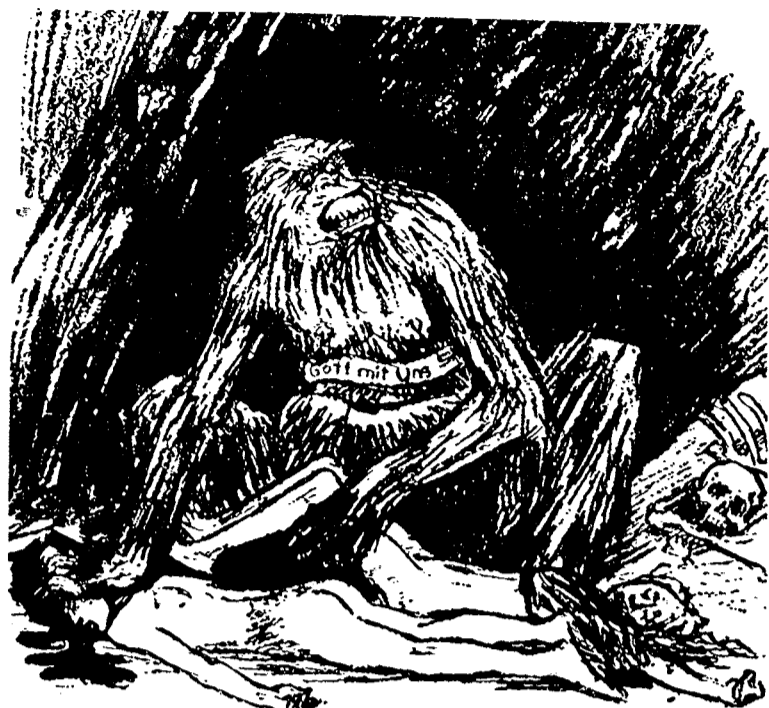
Slik var den britiske krigspropaganda i 1. verdenskrig — — —