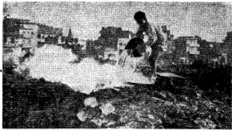
Ung araber forsøker å slukke brannen i ruinene av sitt bombede hjem etter et fransk-britisk flyangrep på Port Said. (Fra VERDEN SIDEN 1945 - Aschehoug 1962).

svar». Det kristelige standpunkt var, som den engelske kirke alt hadde formulert, det, at krigføring er urett uten at det foreligger en rettfærdig foranledning. I den forbindelse er det bemerkelsesverdig at de som tok avstand fra krigen uten innskrenkninger, det vil altså si de desiderte pasifister, var blant dem som skrek høyt da Neville Chamberlain ble angrepet fordi han ikke var gått til krig for å forsvare Tsjekoslovakia på Münchenerkrisens tid i 1938!