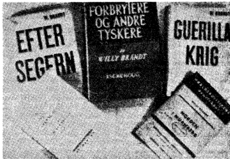
En samling av Brandt-bøker fra dengang han var «nordmann» — til og med «god» sådan.