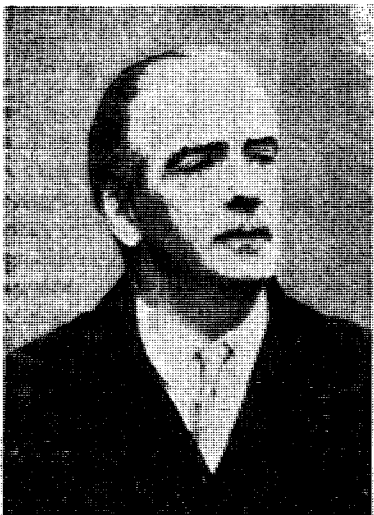
Anthony Eden nolte ikke med å gripe til krig for å nå et politisk mål.

Uten tvil har den uhørte nedslaktning i 1. verdenskrig bevirket en endring i den offentlige mening. Mange bekjente seg til den dengang nye oppfatning, at krigen var blitt så skrekkinngående at det måtte være moralsk galt å anvende den. Litt etter litt kom det overveiende flertall av siviliserte mennesker til den slutning at hvis krigføring var en forbrytelse, så måtte også det å gå til krig være en forbrytelse per se. Men denne oppfatning ble alltid innskrenket ved en eller annen unntagelse som gjorde den betydningsløs, for eksempel «uten i selvfor-