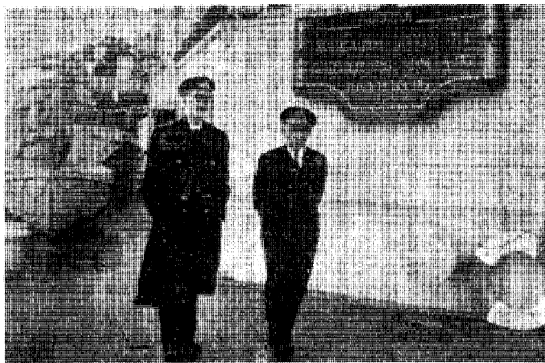
«— ingen forstod det bedre enn de britiske offiserer med hvem Kongen hadde omgang».