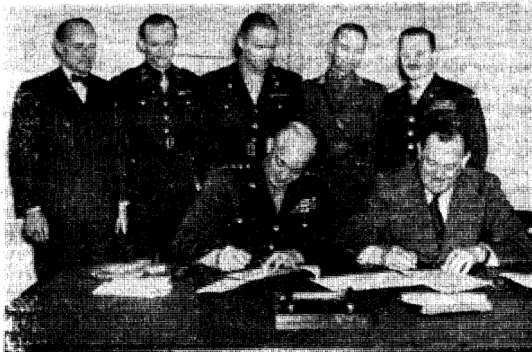
Avtalene om den nye okkupasjon undertegnes i London 16/5—44.

Kongen følte det da tydeligvis som plikt å instruere sitt folk om okkupasjonsens virkninger. Den 26. august 1940 hyldet han i kringkastingen Administrasjonsrådet «for å ha gjort seg fortjent av fedrelandet ved — å stå som mellomledd mellom de nåværende makthavere og befolkningen i Norge». Altså for samarbeide med okkupanten, et samarbeide, der bl. a. straks før, 5/8 1940, medførte oppløsning av norsk