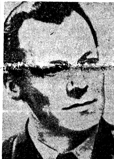
Willy Brandt i norsk majorsuniform. Mindre kunne ikke gjøre det! Deri lignet han sine norske bruknegevær-venner.

Vi synes den er påkrevet siden Brandt deltar i norsk valgkamp på Arbeiderpartiets side.