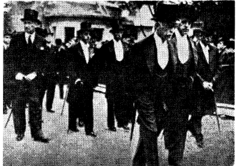
De mektige Rothschilder marsjerer opp ved en begravelse.

Fra «Tages-Anzeiger» for 10/7 1965 henter vi dette: