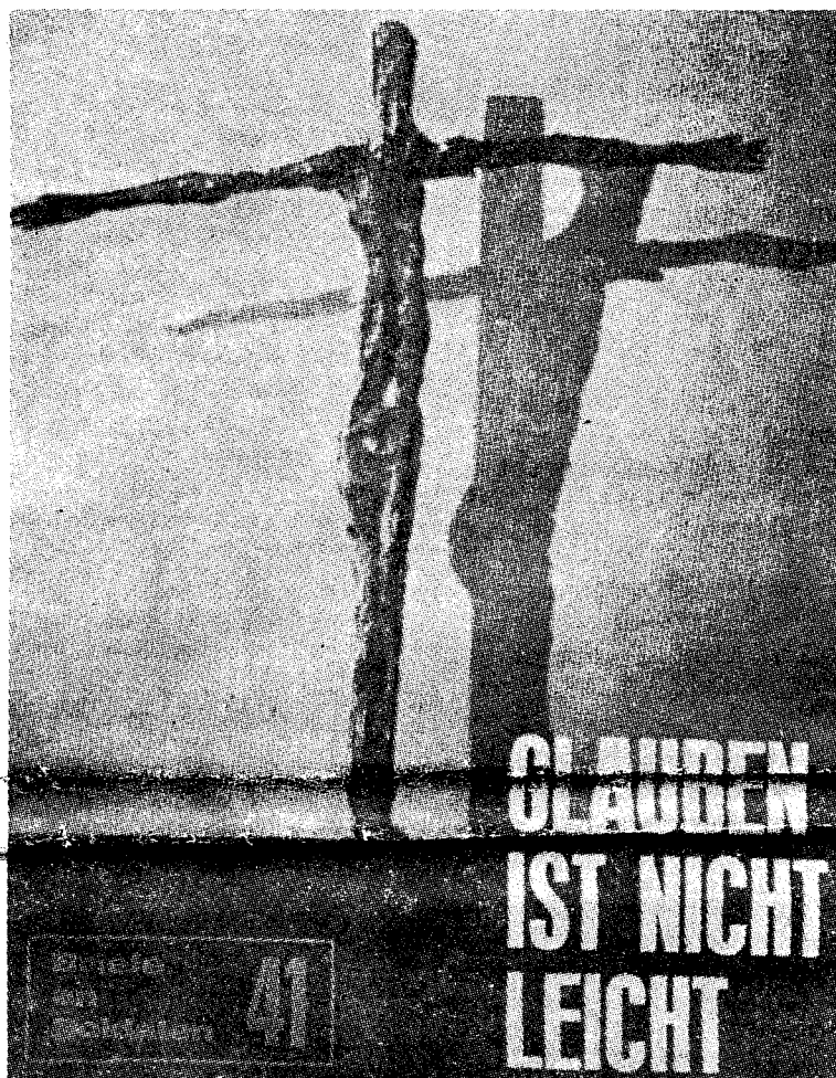
Nei, «Glauben ist nicht leicht» når kirken anvender slike krusifiks som denne prøve på tysk kirkelig soldatpropaganda.

Det har vært stort oppstyr i den mest ugudelige del av norsk dagspresse, i første rekke da i DAGBLADET, over at en mann som bekjenner seg som kristen ble sjef for Kirkedepartementet. Vi skal ikke her ha sagt noe om