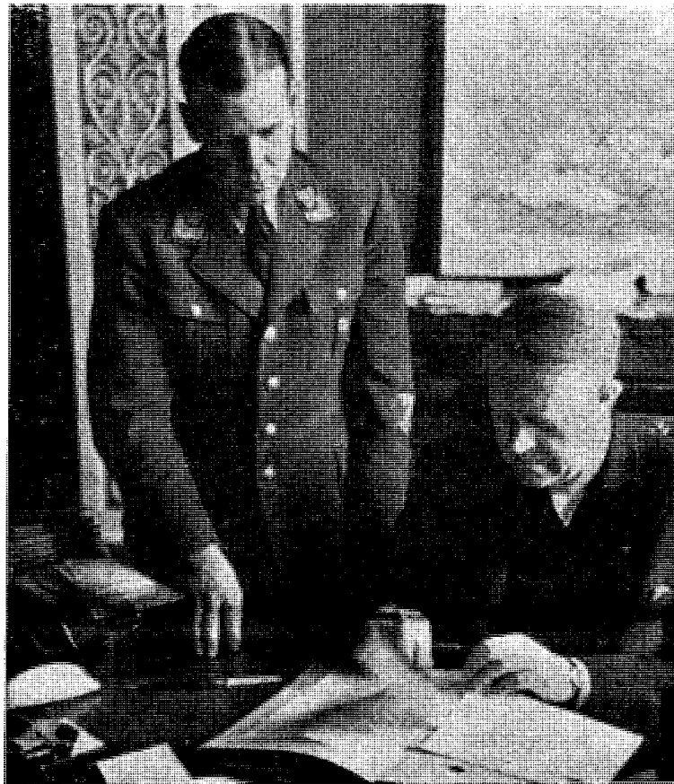
Ministerpresidenten og hans kansellist.