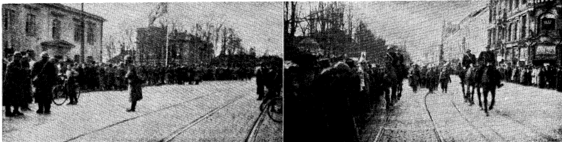
To døgn efter at tyskerne, slik en ser det på disse bilder, hadde besatt alle nøkkelposisjoner skulle norske vernepliktige fra noen enkeltavdelinger sørpå møte ifølge regjeringens tøve«mobilisering».