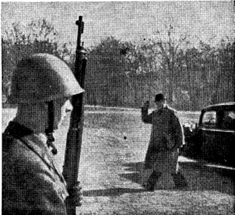
Quisling kommer til sitt kontor på Slottet.

Idag: Motstandsmannen Canaris brukte ikke kontakter i utlandet som sympatiserte med nasjonalsosialismen. — Quisling som hund i hans keglespill