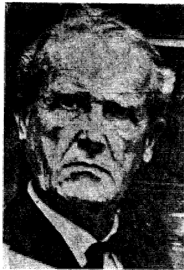
opp langs Frognerkilen.

«I sommer (1938) innkalte bondehøvdningene bøndene til Oslo, men ikke i noen slik alvorlig hensikt. De ble sendt i tog til kongen, men bare for å hilse på ham i all gemyttlighet, slett ikke for å kreve orden i forsvaret av ham. De ble stillet ansikt til ansikt med vår marxistiske statsminister, ikke som anklagere, men som ærbødige beundrere av ham som leder av vår tids pengeutdelende statsmakt. De hørte en preken av Ronald Fangen, han var vel ment som en slags motgift mot Nygaardsvold. De fikk se på skuespill og «den vakre VIKAN-utstillingen», som bondehøvdningene kalte det fremmedartede jugl som var klistret