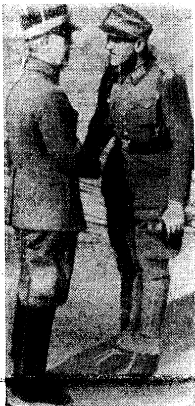
Alle de sydlige divisjoner kapitulerte etterhvert

I juni 1940 hadde alle de sydlige divisjoner kapitulert og det pågikk bare kamper mellom den siste norske divisjon, 6. divisjon og tyskerne. I disse kamper i Narvik-området deltok det også tropper fra de allierte sammen med de norske nøytralitetsforsvarere, men da disse allierte tropper under presset av den tyske offensiv på vestfronten i hui og hast og uten forhåndskonferanse med den norske overkommando ble evakuert, ble stillingen for de norske styrker uholdbar. Under disse omstendigheter gav regjeringen Nygaardsvold ordre til general Ruge om å innstille fiendtlighetene og avslutte en våpenstillstandsavtale med tyskerne. Selvdro Kongen og regjeringen på et britisk skip til England og beordret også sjefen for 6. divisjon, general Fleischer til å følge med som såkalt militær rådgiver. Den norske forsvarssjefen, general Ruge, overtok da også den direkte kommando over 6. divisjon. Forsvarssjefen hadde ellers kommandoen over samtlige norske stridskrefter tillands, til sjøs og i luften. Via Sverige søkte han kontakt med den tyske