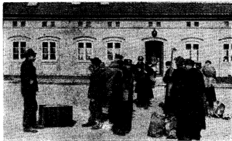
Krigsfangene ble frigitt av tyskerne

Følgende kapitulasjonsavtale er avsluttet mellom sjefen for de tyske stridskrefter i Nord-Norge, generalløytnant Dietl og den av sjefen for de norske tropper i Nord-Norge general Ruge utsendte befullmektigede offiser, oberstløytnant Wrede-Holm.