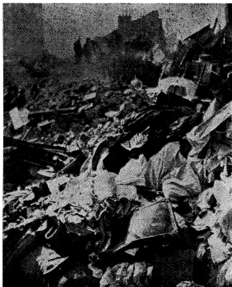
Resultater av Lindemann-planen