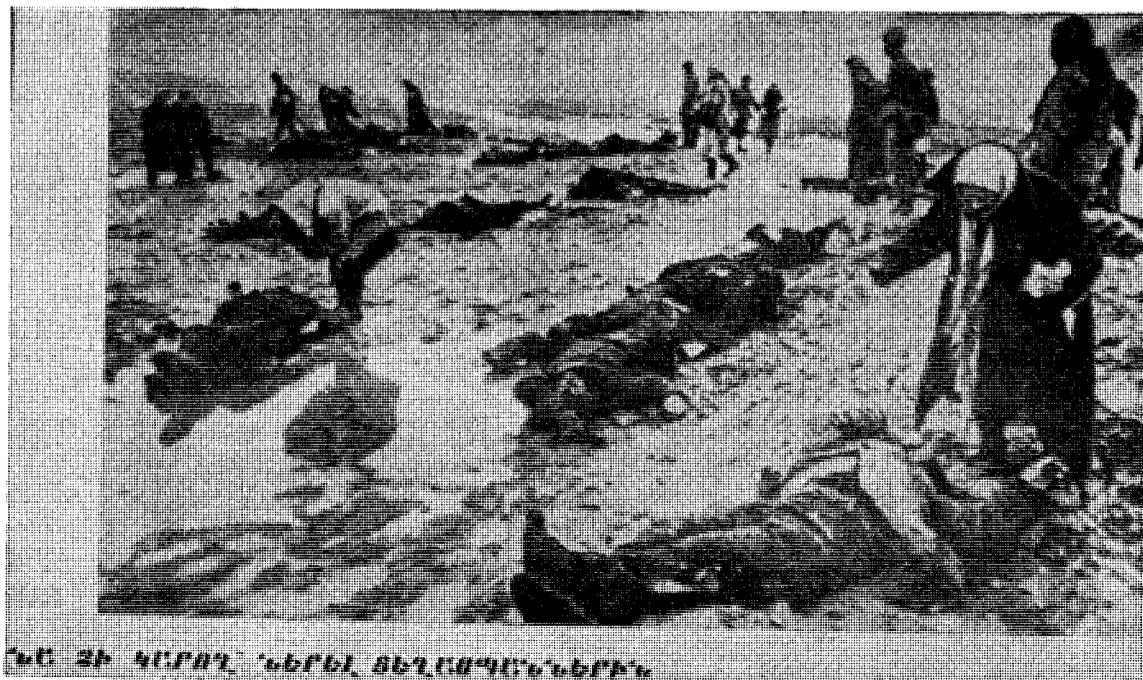
Krig rammer hårdt også sivilbefolkningen. Her leter sivile på Kertsjhalvøya etter pårørende blant de drepte da slaget hadde passert landsbyen deres.

LORD ISMAY, sekretær for imperiets forsvarsråd: «Vi var fullstendig i villrede med hva Neville Chamberlain ville gjøre. Jeg kan huske hvorledes vi om natten før vi endelig erklærte krigen, sank på kne og bad: «O, Gud, la