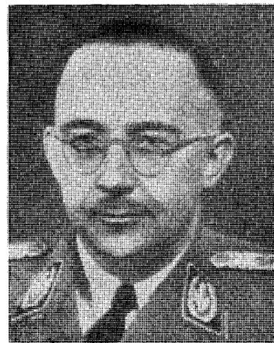
Gåten Heinrich Himmler.

tidens historikere vil være i stand til større objektivitet enn de ynkelige etterplaprer av krigspropagandaen som opptrer idag og hvis oppgave det synes å være ikke å finne sannheten, men ved historieforfalskning å levere et slags moralsk forsvar for de alliertes Tysklandspoli-