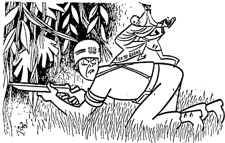
DEUTSCHE WOCHEN-ZEITUNG bringer denne fornøyelige karakteristikk av amerikanernes innsats i Vietnam.