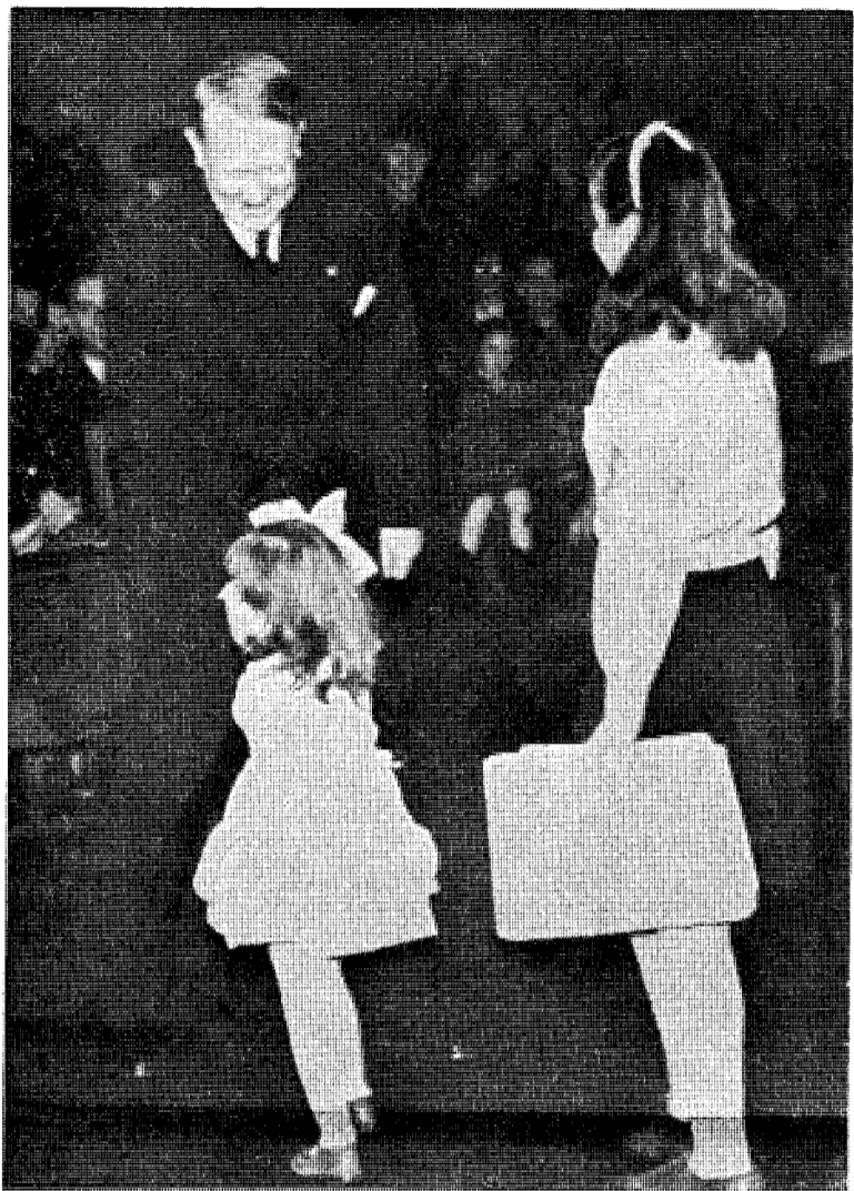
Det er bare gode mennesker barn og dyr møter tillitsfullt.

FOR NORGES TO HEIMEFRONTER: KONGENS HEIMEFRONT OG QUISLINGS HEIMEFRONT