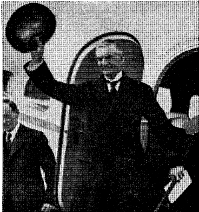
Chamberlain vender tilbake fra München med den fred verden ventet på, men som Churchill fikk ødelagt med hjelp av Roosevelt.