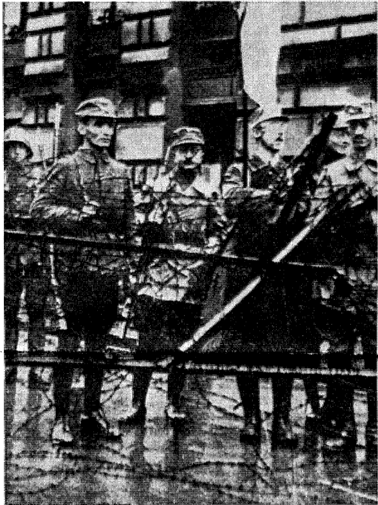
Heinrich Himmler var et gammelt partimedlem, som deltok også under kupforsøket i München. Her ser man ham postert som fanebærer foran det bayerske krigsministerium.

Nye opplysninger både om hans liv og hans død