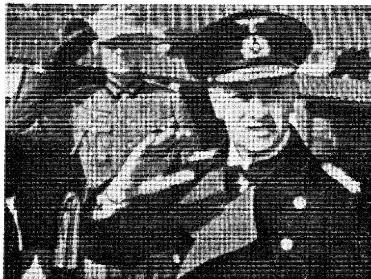
Storadmiral Erich Raeder som tok opp spørsmålet om baser i Norge allerede 3. oktober 1939 — lenge før Quislings Tysklandsbesøk.