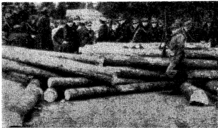
Norske soldater lager veisperring i aprildagene 1940.