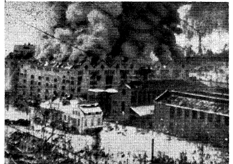
Rjukan bombes i november 1943.

USA-GENERAL GROVES FORTELLER OM JAKTEN PÅ DE TYSKE VITENSKAPSMENN — OG SLÅR ELLERS FAST AT DE BRITISK-NORSKE TUNGTVANNSAKSJONER VAR UTEN ENHVER BETYDNING