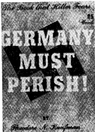
Jødisk hetsbok mot Tyskland før verdenskrigen. «Tyskland må gå under», lyder titlen.

Og hvem, Deres eminense, betaler erstatning til Tyskland?! Bortsett fra at det er en smaksak om man skal ta seg betalt for sine døde, så er tallet 6 millioner galt! Det internasjonale Røde Kors i Genf, som her er rette vedkommende, har slått fast at tallet ikke lar seg nøyaktig fastsette. Det dreier seg imidlertid om ca. 300 000—600 000. Naturligvis et forferdelig tall! Men langt fra 6 millioner! Hvilken uhyre sum ville det ikke bli som Tyskland, hvis det var vanlig å ta seg betalt for sine døde, måtte kreve av sine motstandere, fremforalt av dem som erklærte det krig!? For de milliontap som det måtte lide i to verdenskriger, som Churchill og i siste krig også Roosevelt og bolsjevikken Stalin førte mot Tyskland! (Russland er ikke urettmessig blitt «overfalt» av Tyskland. Den veldige russiske oppmarsj var allerede i full gang da de tyske divisjoner støtte frem! Vi var bare raskere.) Men det verste er at til og med Den hellige far under bedømmelsen av Tyskland, også Hitler-Tyskland, blir ført bak lyset av den falske oppgave på 6