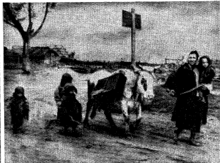
Krigen som rullet over Kertsjhalvøya drev også de sivile på flukt.