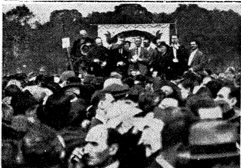
Jødiske demonstrasjoner mot Tyskland før verdenskrigen.