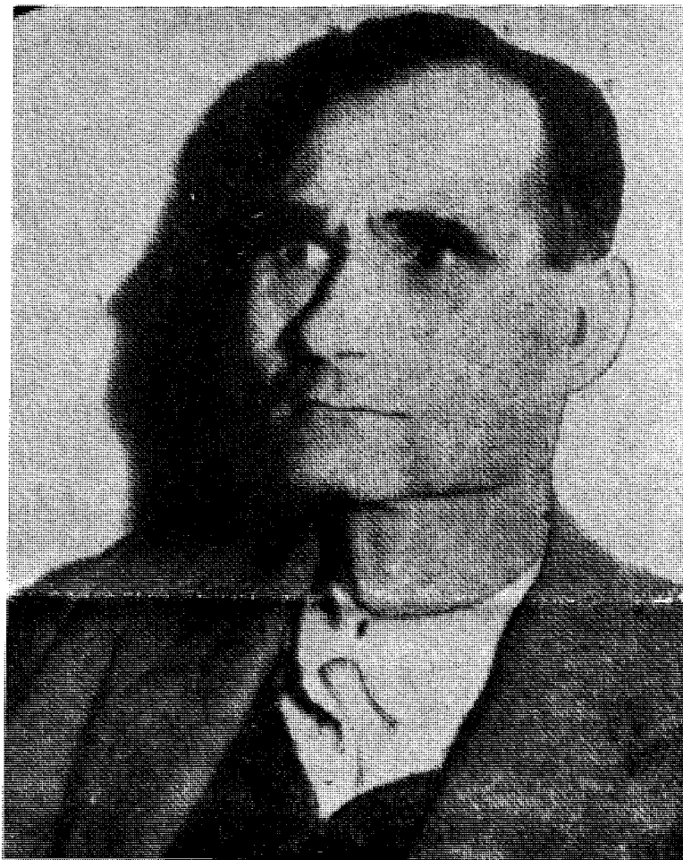
Fredens fange: et kvart århundre bak gitteret

Appell fra Rudolf Hess' hustru og sønn om den fortsatte grusomhet mot den 72-årige gjenværende Spandaufange.