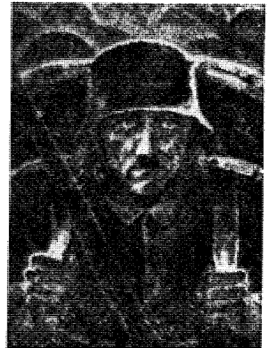
Første verdenskrigs «ukjente soldat» ble etter 1933 hyppig fremstilt med Hitlers ansiktstrekk. Her i et maleri av Engelhardt-Kyffhäuser.