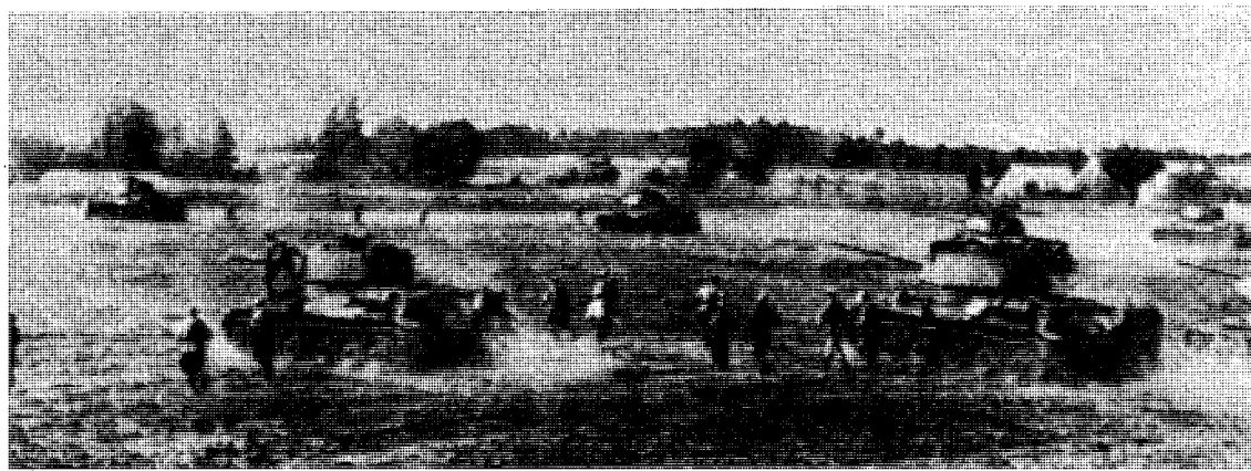
Sovjetisk infanteri går til angrep støttet av stridsvogner.